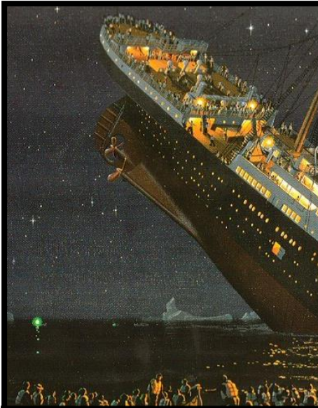
15 avril 1912 Naufrage du Titanic