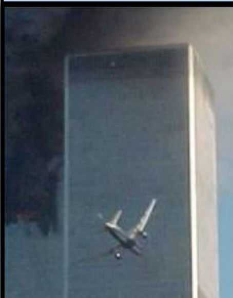
11 septembre 2001 Attentat World Trade Center

Pearl Harbor est une baie peu profonde située sur l'île d'Oahu, dans l'État américain d'Hawaï. Depuis la fin du 19 e siècle, elle abrite une base navale des États-Unis et le quartier général de la flotte du Pacifique des États-Unis. Pearl Harbor a été rendue célèbre suite à l'attaque aérienne surprise de cette base, lancée par le Japon le 7 décembre 1941 dans le cadre d'opérations militaires en lien avec la 2 e Guerre Mondiale. Les États-Unis avaient refusé de se soumettre à une demande du Japon et, après des avertissements, ceux-ci passèrent à l'action.