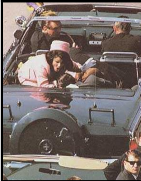
22 novembre 1963 Assassinat de JFK

La proposition d'entamer un processus d'indépendance a été rejeté par 59,56 % des voix exprimées.