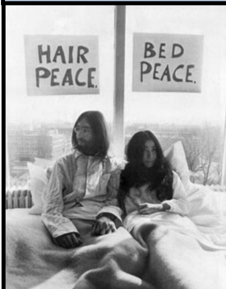
26 mai 1969 Bed In de John Lennon

L'assassinat du président John Fitzgerald Kennedy, 35 e des États-Unis, eut lieu le vendredi 22 novembre 1963 à Dallas, au Texas. Après que le cortège présidentiel eut traversé à vitesse réduite le centre de la ville et alors que la voiture présidentielle, décapotée, passait sur Dealey Plaza, John F. Kennedy fut mortellement blessé par des tirs d'arme à feu. Il est le 4 e président des États-Unis à être victime d'un assassinat et le 8 e à mourir en exercice. Sa mort demeure énigmatique de nos jours.