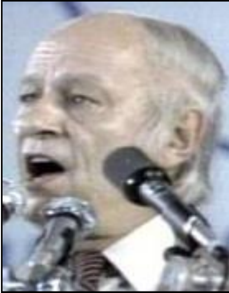
20 mai 1980 Référendum au Québec