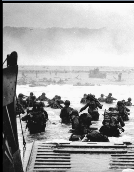
6 juin 1944 Débarquement en Normandie

Les attentats du 11 septembre 2001 sont quatre attentats-suicides perpétrés le même jour aux États-Unis, à quelques heures d'intervalle, par des membres du réseau djihadiste islamiste Al-Qaïda, visant des bâtiments symboliques du nord-est du pays et faisant 2 973 victimes. Deux avions sont projetés sur les tours jumelles du World Trade Center à New York et un troisième sur le Pentagone, siège du Département de la Défense, à Washington. Le quatrième avion, volant en direction de Washington, s'écrase en campagne en Pennsylvanie.