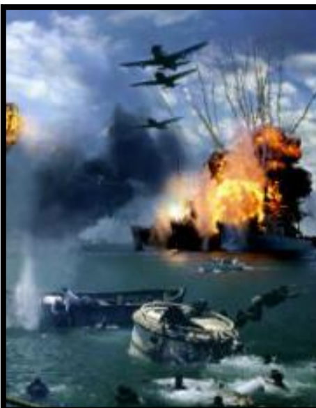
7 décembre 1941 Pearl Harbor