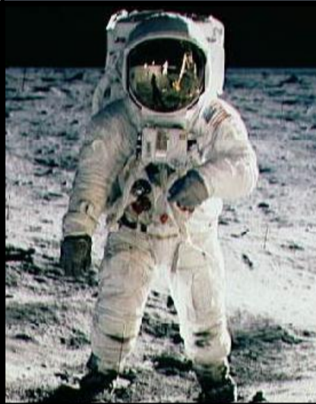
20 juillet 1969 L'homme va sur la lune

Lors de son voyage inaugural, en partance de New York, le paquebot Titanic heurte un iceberg sur tribord avant, le 14 avril 1912 à 23 h 40, heure locale. Il coule le 15 avril 1912 à 2 h 20 au large de Terre-Neuve. Entre 1490 et 1520 personnes disparaissent, ce qui fait de cet événement une des plus grandes catastrophes maritimes en temps de paix pour l'époque. Le drame met en évidence les faiblesses des navires de l'époque concernant le nombre de canots de sauvetage limités et les carences dans les procédures d'évacuations.