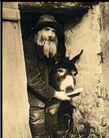
Lolo l'âne ? - ?