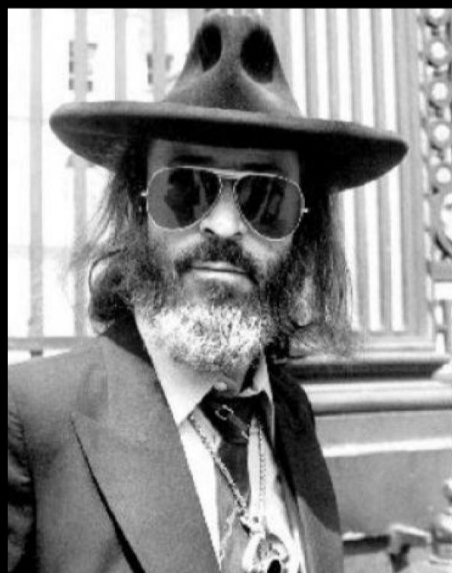
Fernand Legros 1931 - 1983