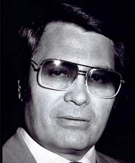
Jim Jones 1931 - 1978