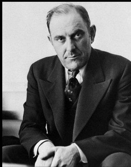
Victor Lustig 1890 - 1947