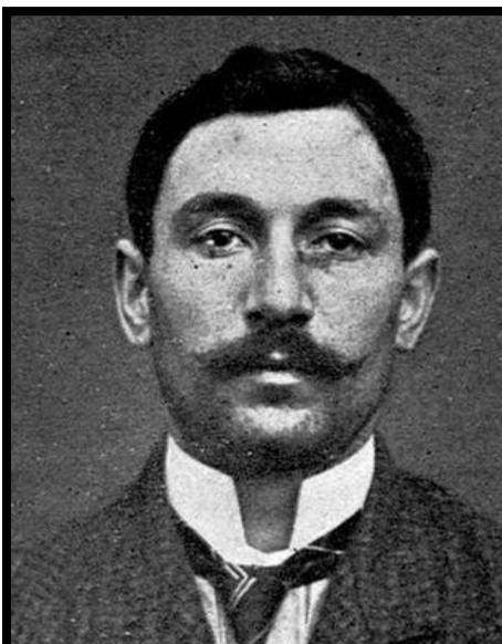
Vincenzo Perrugia 1881 - 1925