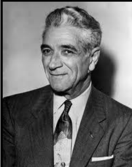
George Adamski 1891 - 1965