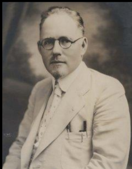
John Romulus Brinkley 1885 - 1942