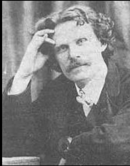
Daniel Dunglas Home 1833 - 1886