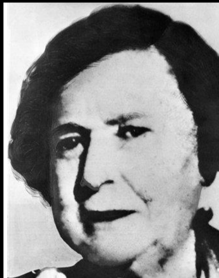
Kate "Ma" Barker 1871 – 1935

Il est mort d'une embolie pulmonaire alors que son 2 e procès était en cours. Complot ?