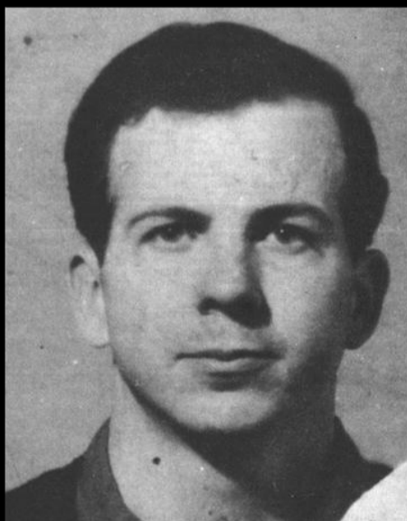
Lee Harvey Oswald 1939 – 1963

Il a été exécuté à la chaise électrique.