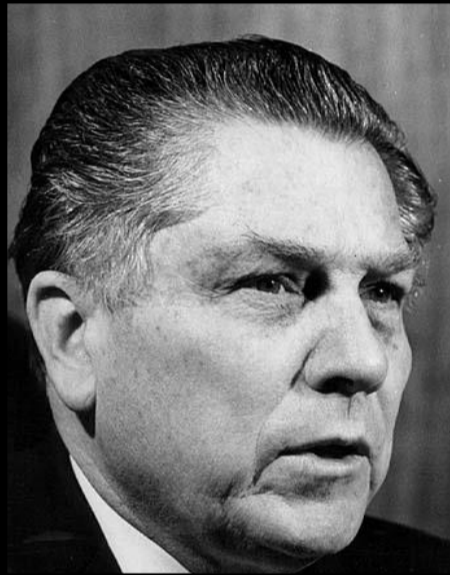
Jimmy Hoffa 1913 – 1975 (?)