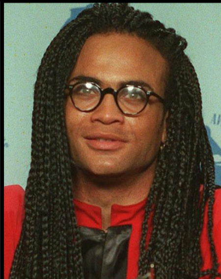
Rob Pilatus 1965 - 1998