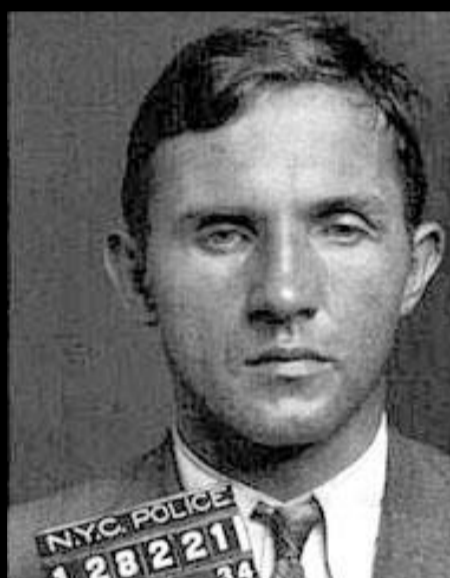
Bruno Hauptmann 1899 - 1936

Lui et ses complices sont présumés morts noyés le jour de leur évasion en tentant de rejoindre le rivage dans un radeau de fortune.