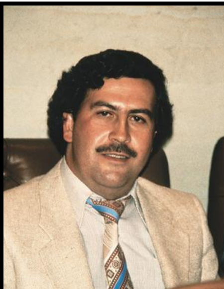
Pablo Escobar 1949 - 1993