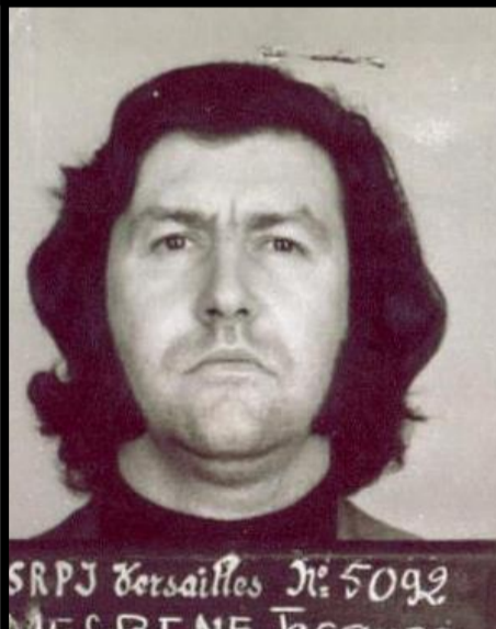
Jacques Mesrine 1936 - 1979