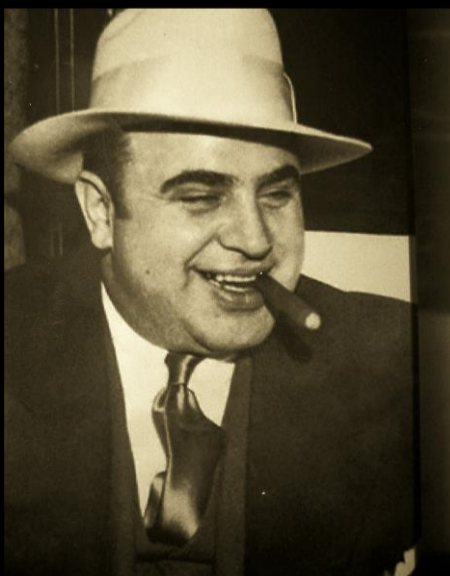
Al Capone 1899 - 1947