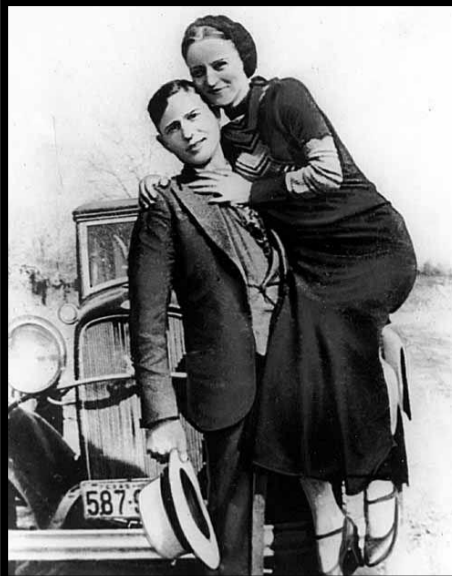
Bonny and Clyde 1910-1934 1909-1934