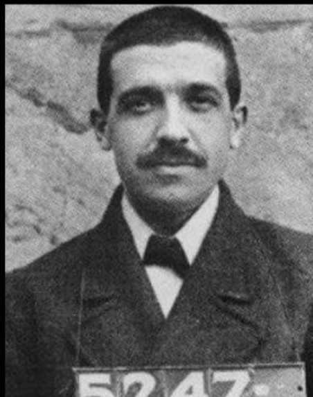
Charles Ponzi 1882 - 1949