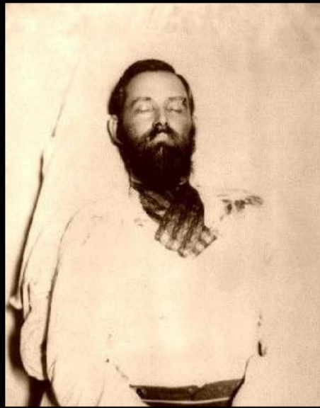
Jesse James 1847 - 1882