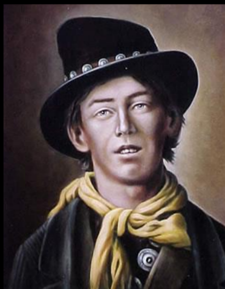
Billy The Kid 1859 - 1881