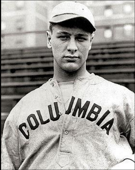
Lou Gehrig 1903 - 1941

Il est interné dans une clinique psychiatrique à Lausanne, où il meurt le 26 mai 1904.