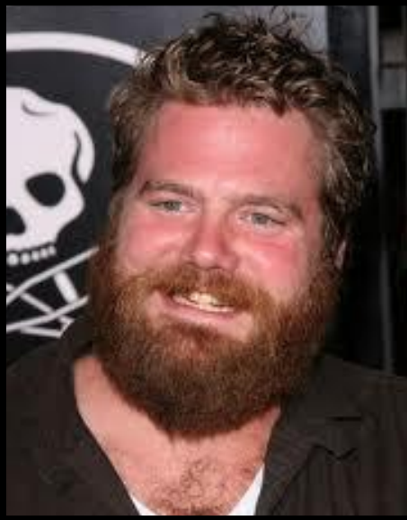
Ryan Dunn 1977 - 2011