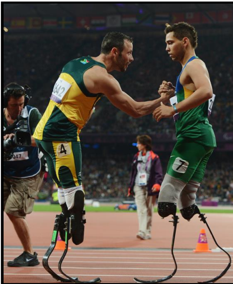
JEUX PARALYMPIQUES TOUS LES 4 ANS