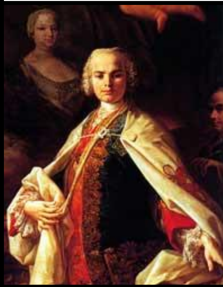
Carlo Broschi 1705 - 1782