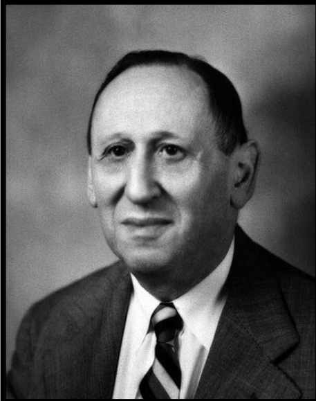
Leo Kanner 1894 - 1981