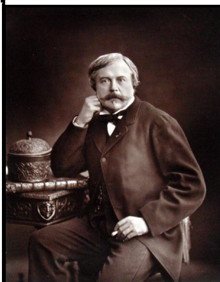
Edmond de Goncourt 1822 -1896