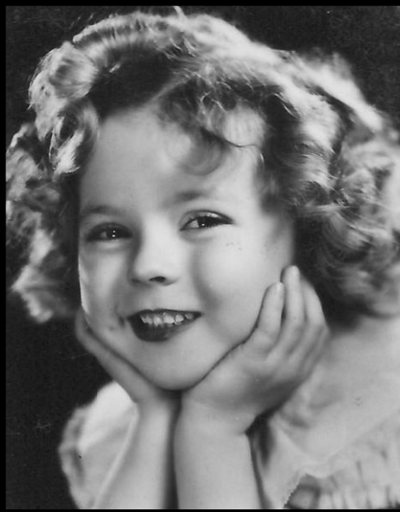
Shirley Temple 1928 - 2014