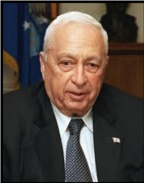
Ariel Sharon 1928 - 2014