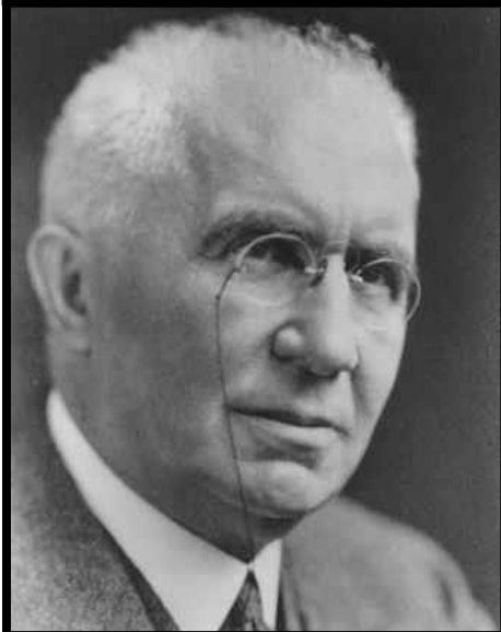
Émile Berliner 1851 - 1929

Sa tombe se trouve dans le chœur de la basilique Saint-Laurent-hors-les-Murs.