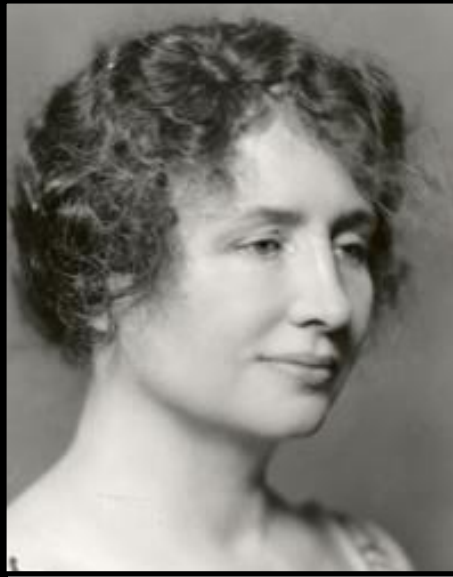
Helen Keller 1880 - 1968