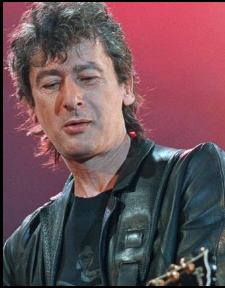
Alain Bashung 1947 - 2009