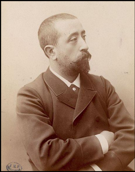
Gilles de la Tourette 1857 - 1904

En 2005, 2 attaques cérébrales, le plongent dans le coma. Il en meurt 8 ans plus tard.