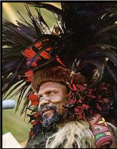
Sobhuza II 1899 - 1982