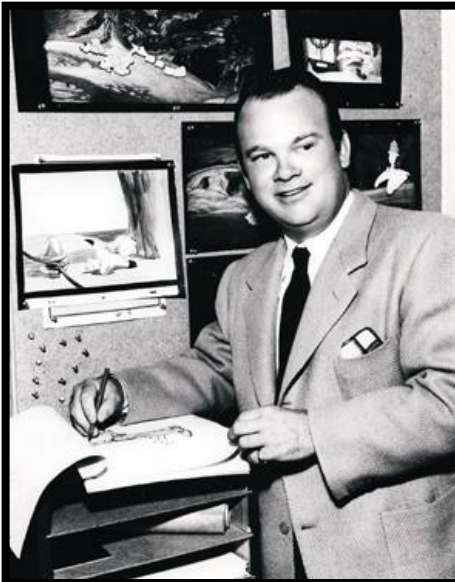
Tex Avery 1908 - 1980