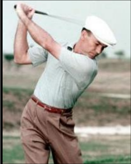
Ben Hogan 1912 - 1994