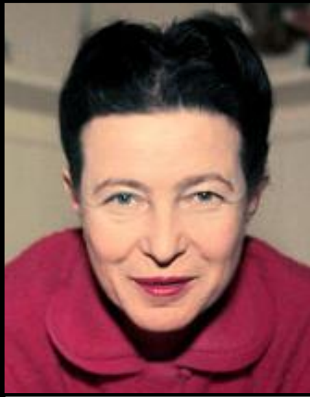
Simone de Beauvoir 1908 - 1986