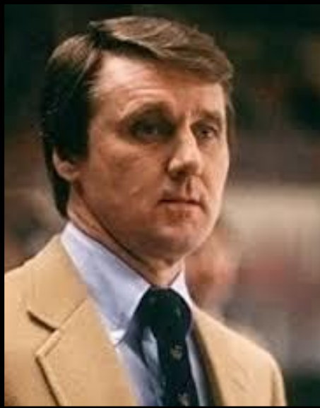
Herb Brooks 1937 - 2003