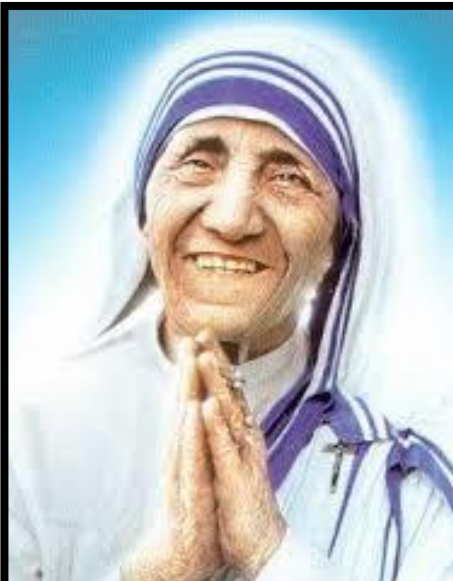
Mère Thérésa 1910 - 1997