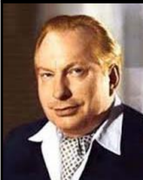
Ron Hubbard 1911 - 1986