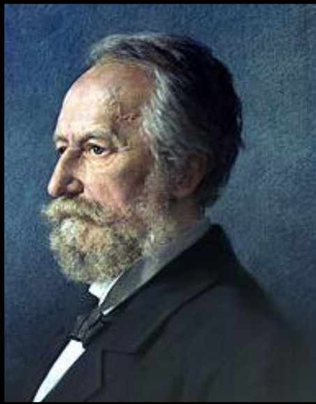
Adolf Fick 1829 - 1901

Plusieurs problèmes de santé finirent par avoir raison d’elle.