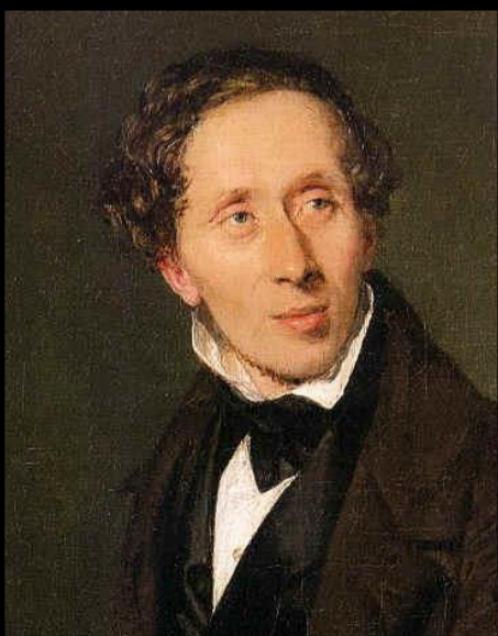
Hans Christian Andersen 1805 - 1875