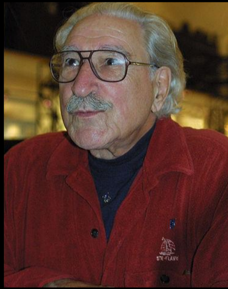
Michel Chartrand 1916 - 2010

Du 6 au 14 juillet, les fêtes de la Saint-Firmin donnent lieu à de bruyantes réjouissances populaires. De grandes courses de taureaux sont organisées. La manifestation la plus spectaculaire est l' encierro . Les taureaux qui combattront le soir même sont lâchés dans les rues suivant un itinéraire précis, long de 800 m, Les gens vont à la rencontre des puissants taureaux et se mettent à courir devant eux.