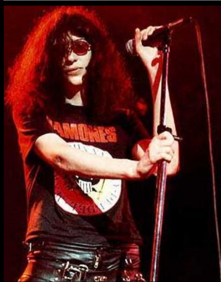
Joey Ramone 1951 - 2001