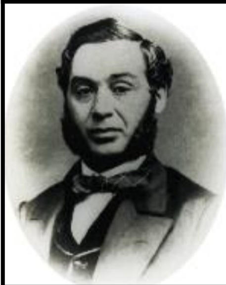
Oscar Levi Strauss 1829 – 1902

Après vingt d'ans d'emphysème, il meurt d'un arrêt respiratoire