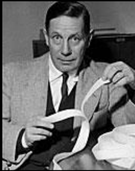
Georges de Mestral 1907 - 1990