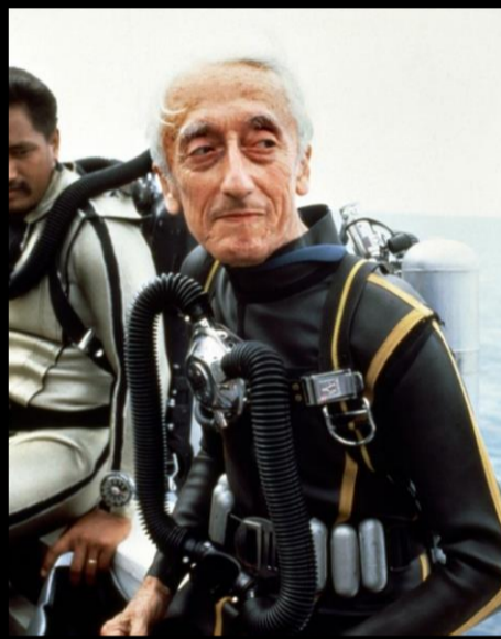
Jacques-Yves Cousteau 1910 - 1997