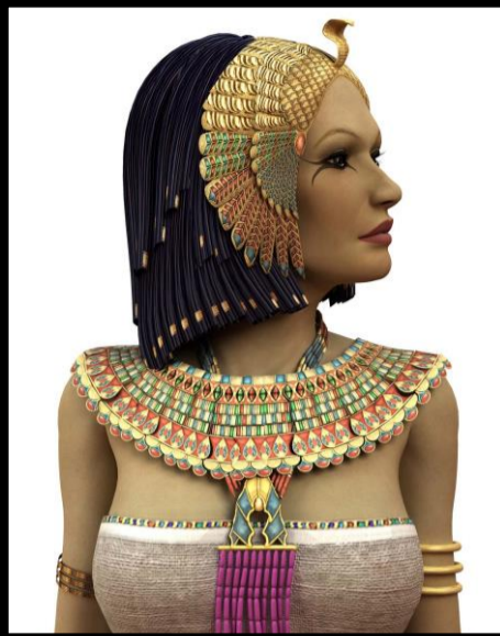
Cléopâtre VII 69 AJC -30 AJC