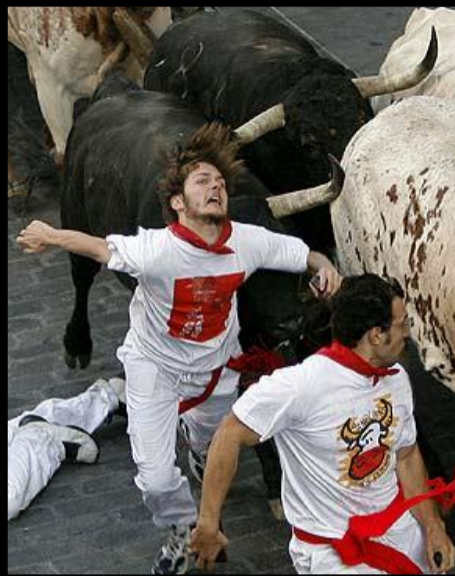
L'ENCIERRO MOIS DE JUILLET