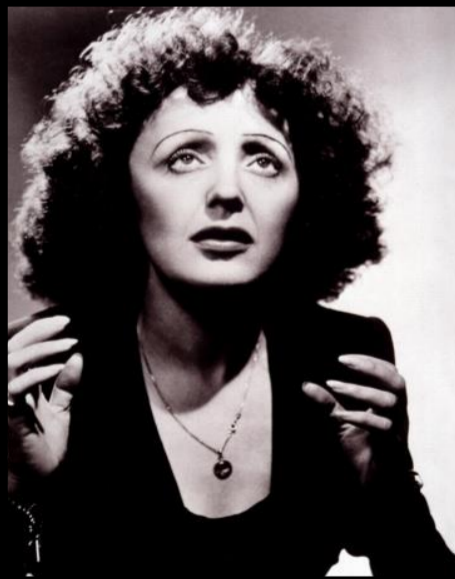
Édith Piaf 1915 - 1963