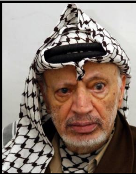
Yasser Arafat 1929 - 2004