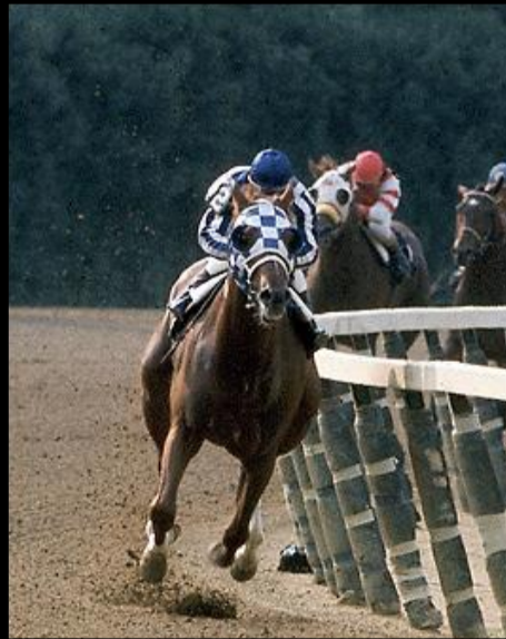
Secretariat 1970 – 1989