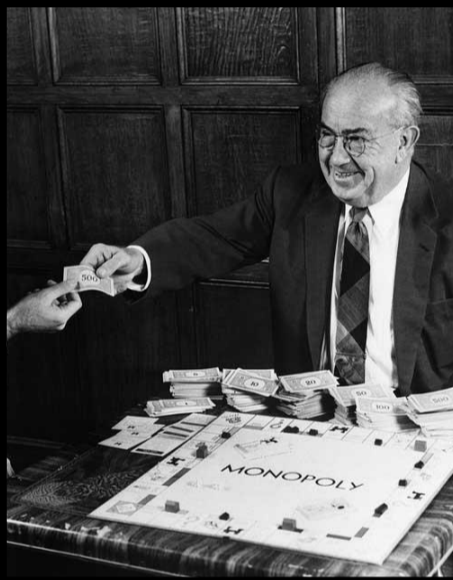
Charles Darrow 1889 – 1967

Il meurt d'une overdose de drogues, dans les bras de son frère et sa soeur