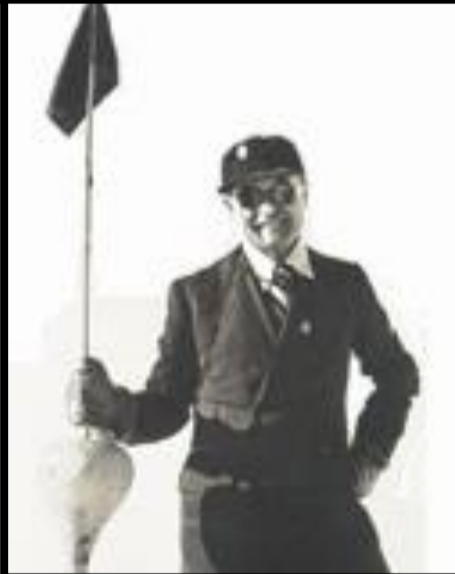
Arnold Lunn 1888 – 1974