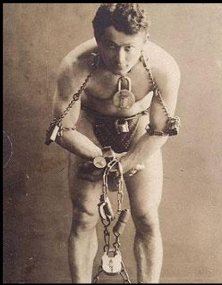
Harry Houdini 1874 - 1926