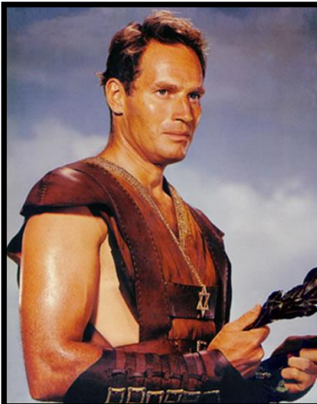
Charlton Heston 1923 - 2008