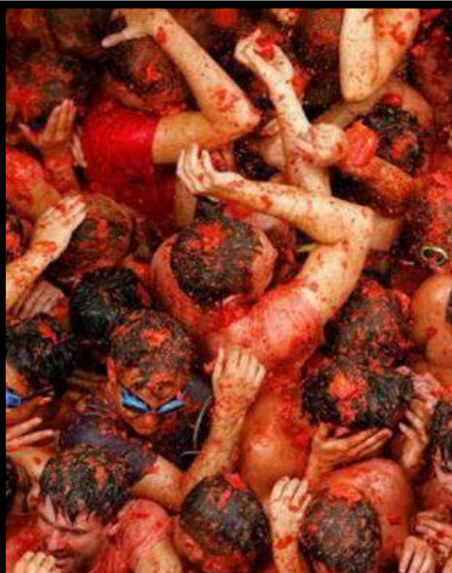
LA TOMATINA DERNIER MERCREDI D'AOÛT