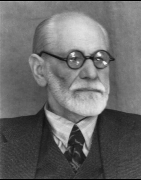
Sigmund Freud 1856 - 1939

Il est mort d'une pneumonie bactérienne.