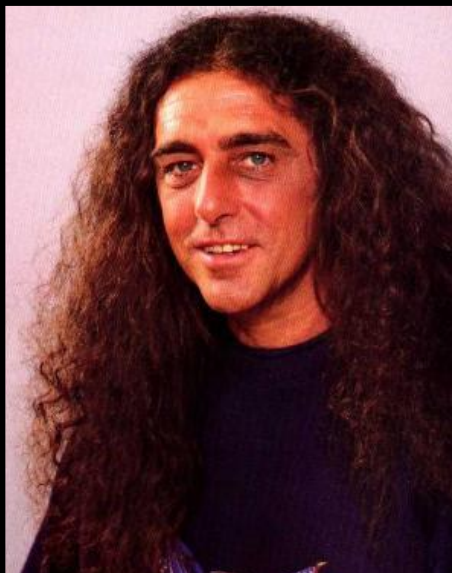
Gerry Boulet 1946 - 1990

Cette fête a lieu à Valence, en Espagne. Des milliers de participants viennent de chaque coin de la planète pour cette festivité de la bataille des tomates ! La bataille est la scène de milliers de tomates volantes et d'éclats de rire et il y a évidemment certaines règles à respecter comme de ne pas lancer d'objets coupants et de ne lancer que des tomates écrasées