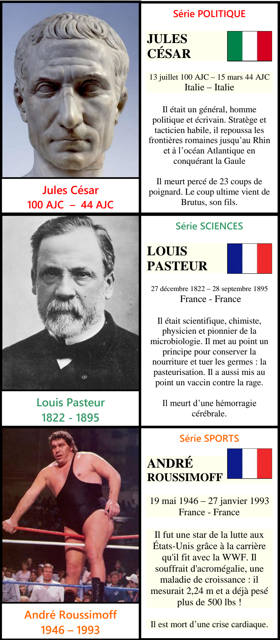
Jules César 100 AJC – 44 AJC