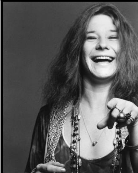
Janis Joplin 1943 – 1970