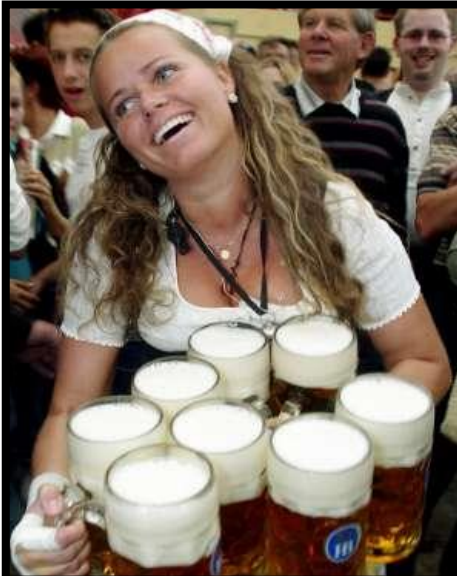
L'OKTOBERFEST MOIS D'OCTOBRE