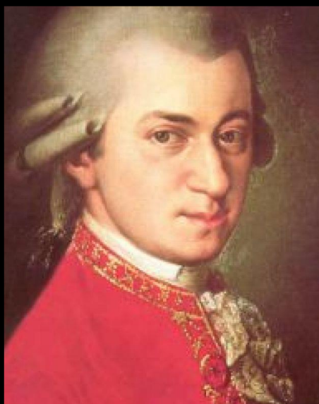
Wolfgang Amadeus Mozart 1756 – 1791