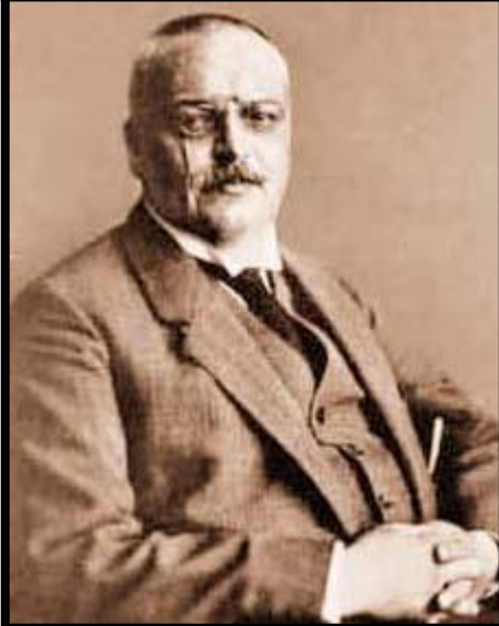
Aloïs Alzheimer 1864 - 1915