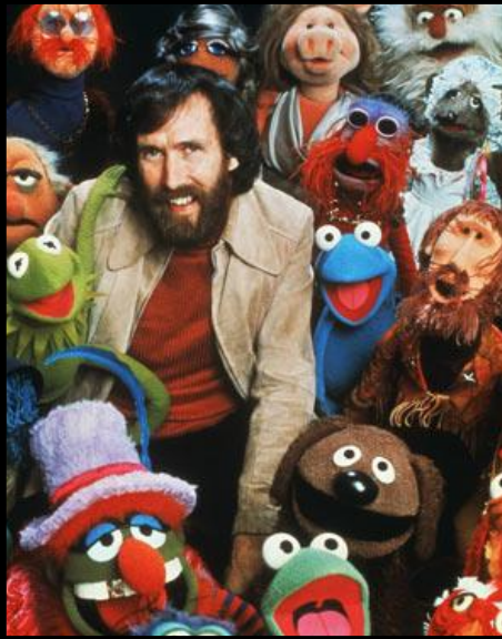
Jim Henson 1936 – 1990

Il décède d'une péritonite consécutive à une rupture de l'appendice.