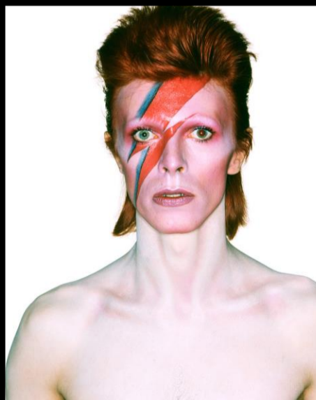
David Bowie 1947 - 2016

Il meurt le à la suite d'un long combat de deux ans contre une tumeur au cerveau.