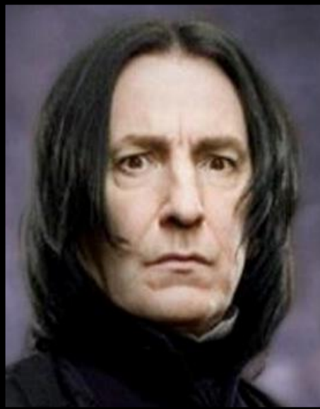
Alan Rickman 1946 - 2016