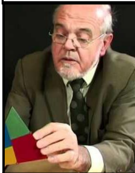
Henry Ernest Dudeney 1857 - 1930

Il meurt des suites d'hypertension et d'hypertrophie cardiaque