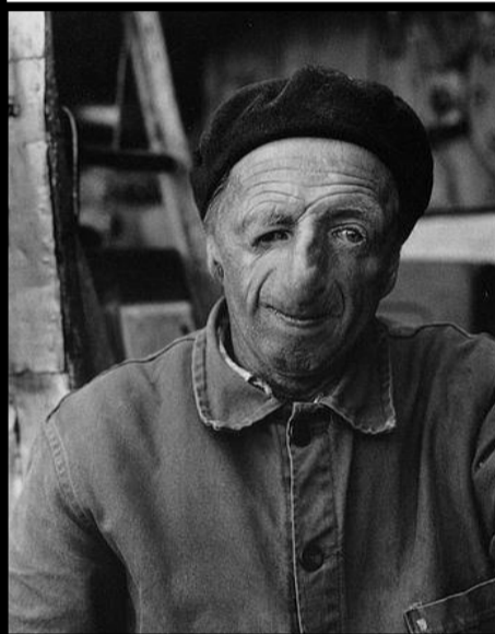
Pierre Avezard 1909 - 1992