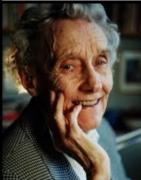
Astrid Lindgren 1907 - 2002