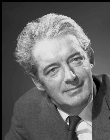
Félix Leclerc 1914 - 1988

On célèbre cette fête au Canada le deuxième lundi d'octobre et aux États-Unis le quatrième jeudi de novembre. Ce jour-là, on remercie Dieu par des prières et des réjouissances pour les bonheurs que l'on a pu recevoir pendant l'année. Aux États-Unis, elle est célébrée de manière plus marquée. On y sert de la dinde et des atocas.