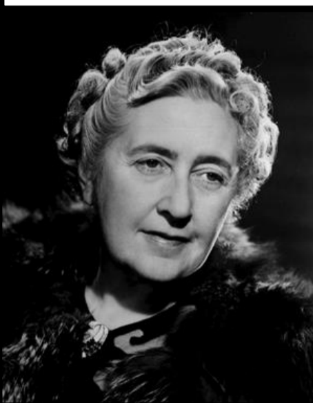
Agatha Christie 1890 - 1976

Heurté par un tramway, il en est décédé quelques jours plus tard.