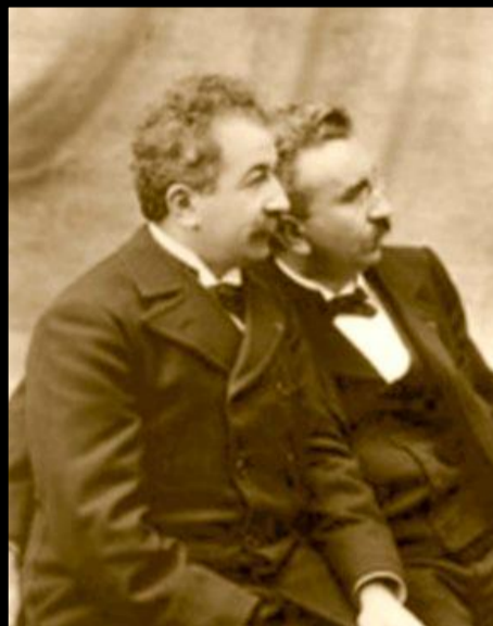
Les frères Lumière 1862 – 1954 1864 - 1948