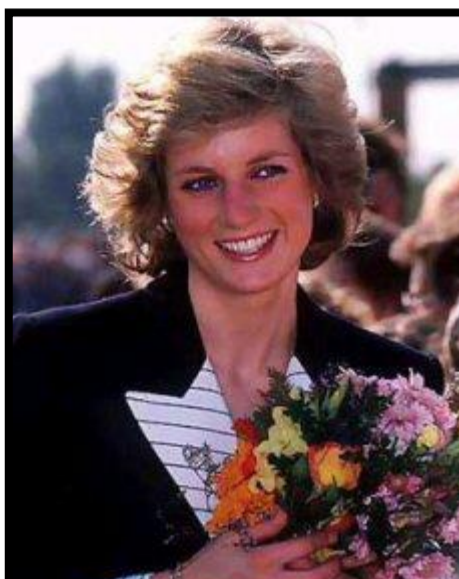
Diana Spencer 1961 – 1997

TOUTES LES INFORMATIONS APPARAISSANT SUR CES CARTES PROVIENNENT D'INTERNET (GOOGLE IMAGES, WIKIPEDIA ET AUTRES)