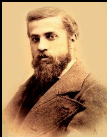
Antoni Gaudí 1852 – 1926

La cause de leur décès respectif n'est pas répertoriée.