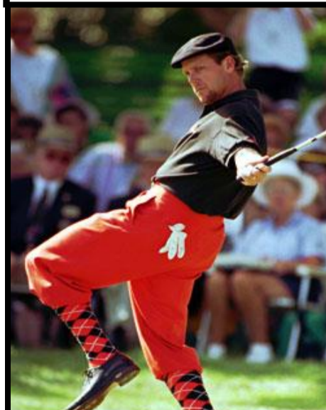
Payne Stewart 1957 – 1999