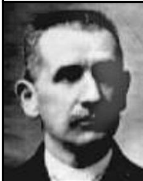
Bernard Courtois 1777 - 1838

Il sera assassiné avec tous les membres de sa famille.