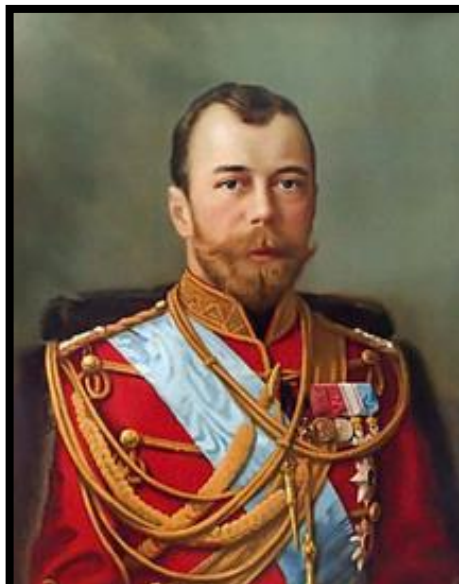
Nicolas II 1868 - 1918

TOUTES LES INFORMATIONS APPARAISSANT SUR CES CARTES PROVIENNENT D'INTERNET (GOOGLE IMAGES, WIKIPEDIA ET AUTRES)