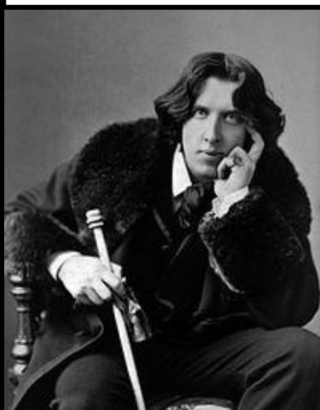
Oscar Wilde 1854 - 1900

Juive, elle luttera sans arrêt pendant la WW2 pour sa liberté. Enceinte de quatre mois, elle est arrêtée puis envoyée à la mort via l'une des chambres à gaz d'Auschwitz-Birkenau, un camp de concentration.