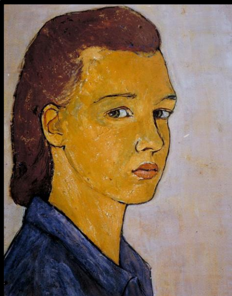
Charlotte Salomon 1917 - 1943

Il trouve la mort à la suite d'un accident dû à un tir de revolver au cours du tournage du film The Crow . Les circonstances de sa mort créent une controverse. Le revolver était réellement chargé.