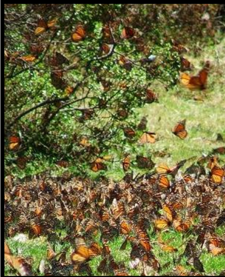
MIGRATION DU MONARQUE EN HIVER