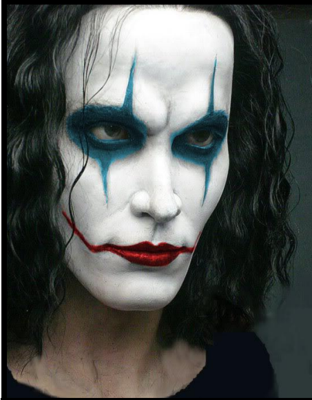
Brandon Lee 1965 - 1993