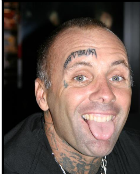
Jay Adams 1961 - 2014

Une rubrique nécrologique mentionne sa mort, en soulignant l'erreur qu'il a faite de ne pas déposer un brevet.