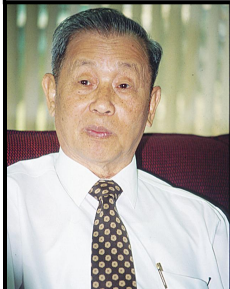
Chaleo Yoovidhya 1923 - 2012