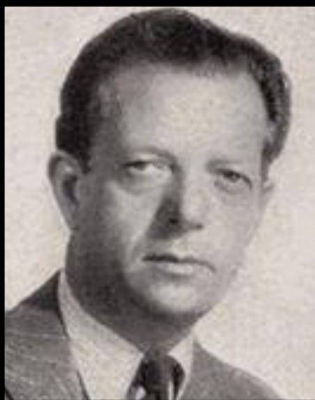
Marcel Duhamel 1900 - 1977