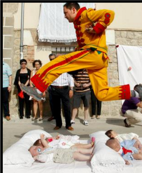
EL COLACHO 60 JOURS APRÈS PÂQUES