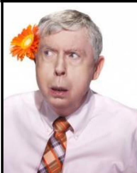
Gilles Latulippe 1937 - 2014

Elle est célébrée pendant la fête du St-Sacrament.