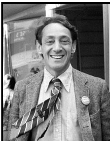
Harvey Milk 1930 - 1978

TOUTES LES INFORMATIONS APPARAISSANT SUR CES CARTES PROVIENNENT D'INTERNET (GOOGLE IMAGES, WIKIPEDIA ET AUTRES)