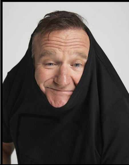
Robin Williams 1951 - 2014