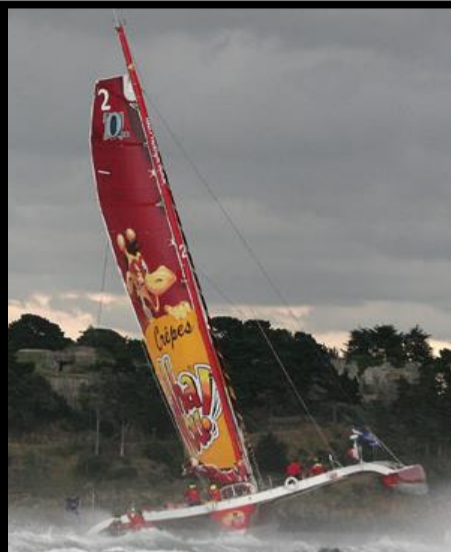
TRANSAT QUÉBEC ST-MALO TOUS LES 4 ANS