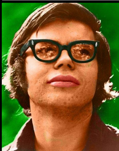
Alan Wilson 1943 - 1970

Il succombe à un cancer des os et des poumons