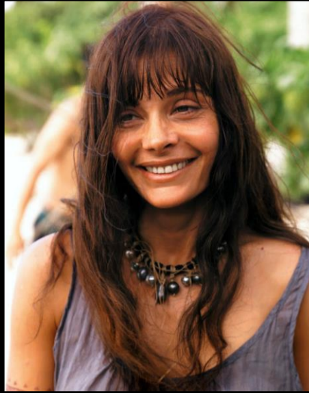
Marie Trintignant 1962 - 2003