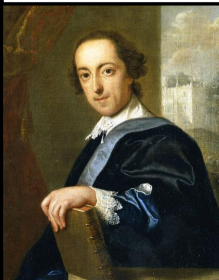
Horace Walpole 1717 - 1797