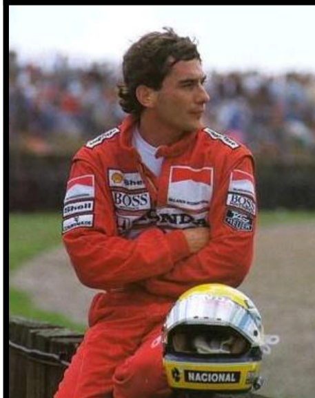
Ayrton Senna 1960 – 1994