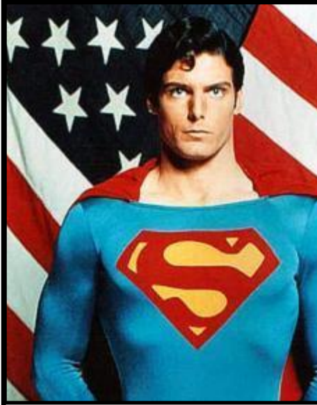
Christopher Reeves 1952 – 2004