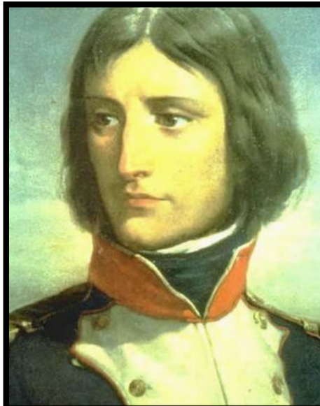
Napoléon Bonaparte 1769 – 1821

TOUTES LES INFORMATIONS APPARAISSANT SUR CES CARTES PROVIENNENT D'INTERNET (GOOGLE IMAGES, WIKIPEDIA ET AUTRES)