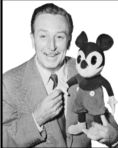
Walt Disney 1901 – 1966