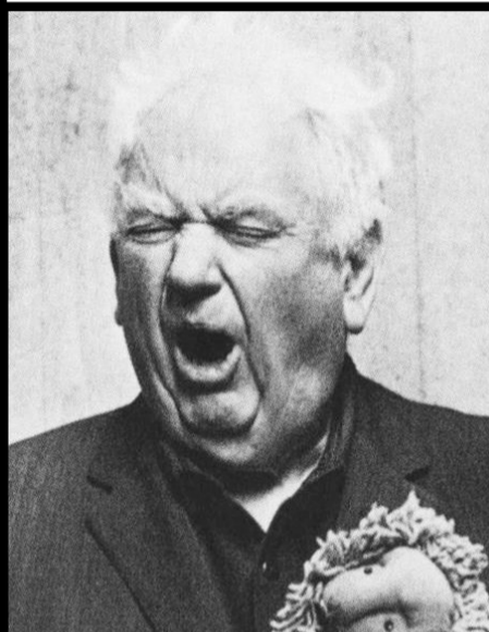
Alexander Calder 1898 - 1976