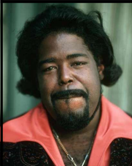
Barry White 1944 - 2003