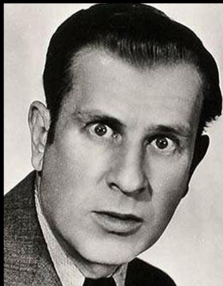
Bud Abbott 1895 - 1974