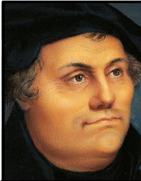
Martin Luther 1483 -1546

TOUTES LES INFORMATIONS APPARAISSANT SUR CES CARTES PROVIENNENT D'INTERNET (GOOGLE IMAGES, WIKIPEDIA ET AUTRES)