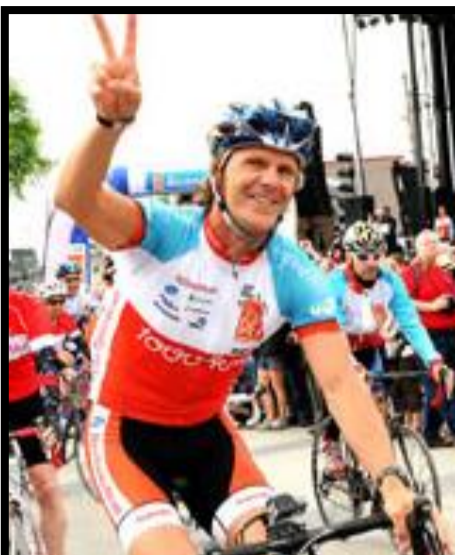
GRAND DÉFI PIERRE LAVOIE MOIS DE JUIN