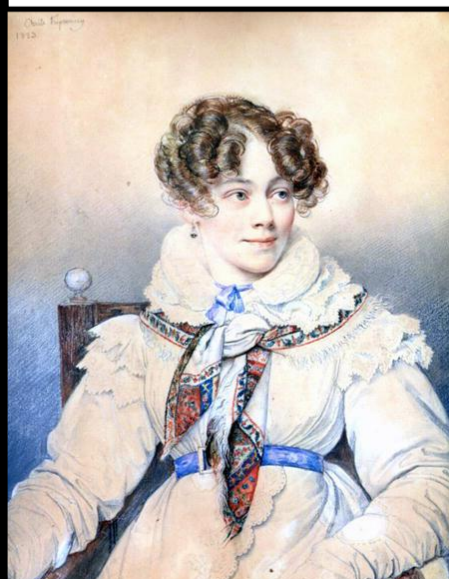
La Comtesse de Ségur 1799 - 1874