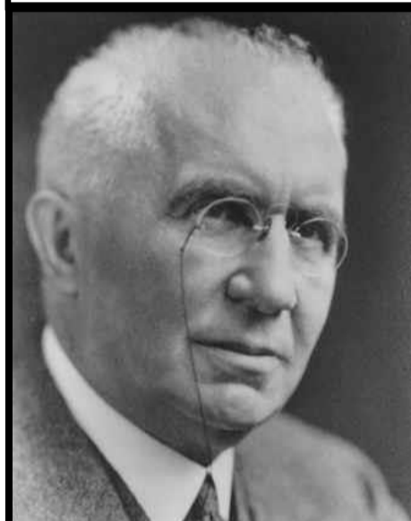
Émile Berliner 1851 - 1929

Sa tombe se trouve dans le chœur de la basilique Saint-Laurent-hors-les-Murs.