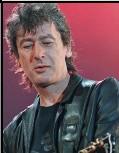
Alain Bashung 1947 - 2009

Il est décédé en 1987 d'une surdose de drogue à Washington.