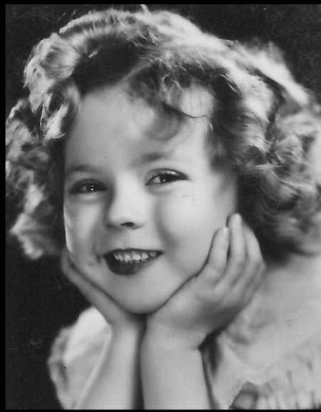
Shirley Temple 1928 - 2014