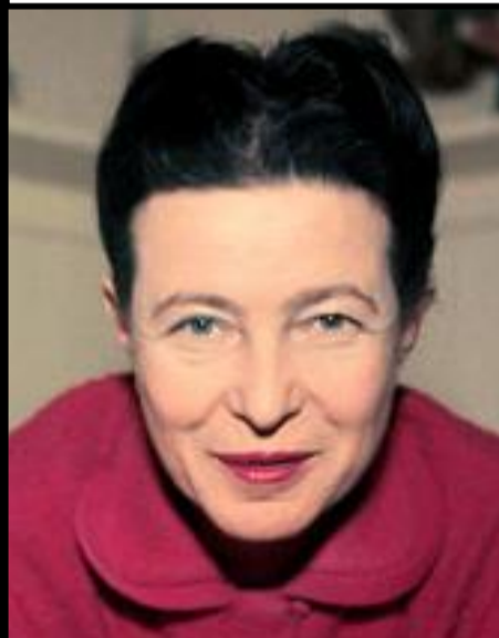
Simone de Beauvoir 1908 - 1986