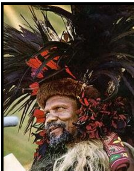
Sobhuza II 1899 - 1982