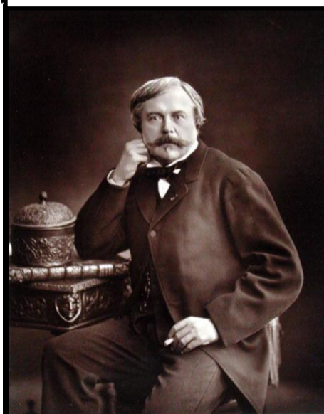
Edmond de Goncourt 1822 - 1896