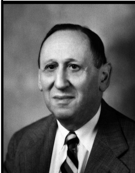
Leo Kanner 1894 - 1981