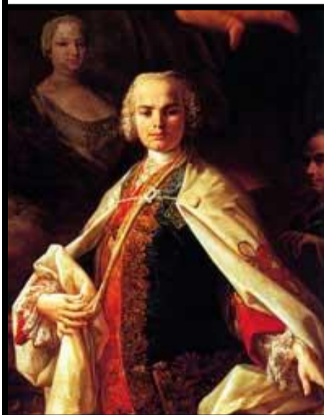
Carlo Broschi 1705 - 1782