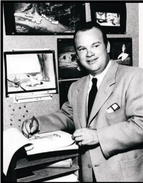
Tex Avery 1908 - 1980