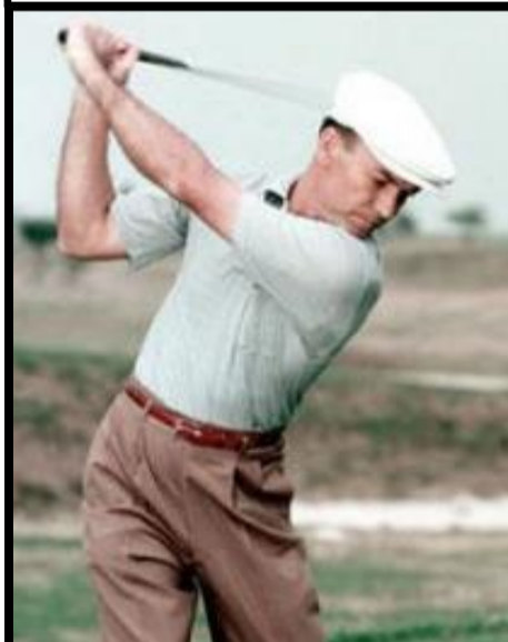
Ben Hogan 1912 - 1994