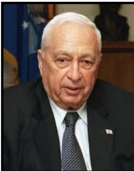
Ariel Sharon 1928 - 2014