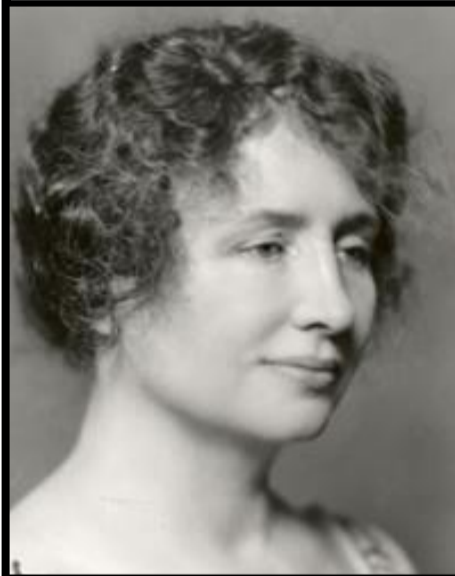
Helen Keller 1880 - 1968