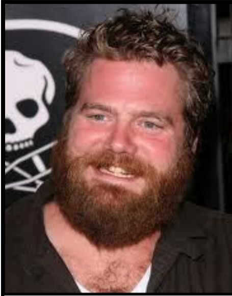
Ryan Dunn 1977 - 2011