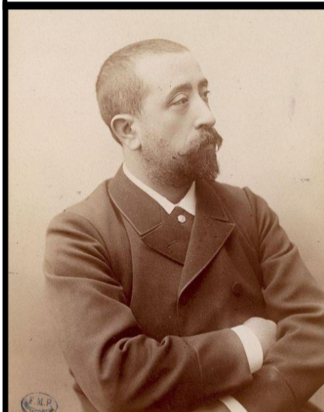
Gilles de la Tourette 1857 - 1904

En 2005, 2 attaques cérébrales, le plongent dans le coma. Il en meurt 8 ans plus tard.