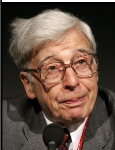
Robert Edwards 1925 - 2013