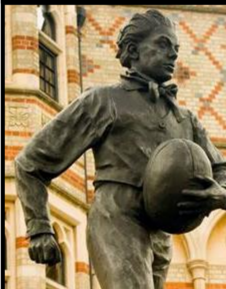
William Webb Ellis 1806 - 1872