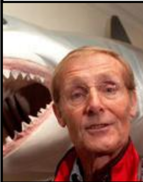
Peter Benchley 1940 - 2006