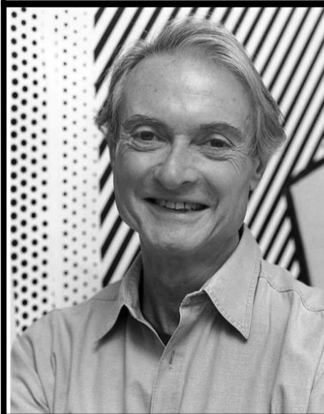
Roy Lichtenstein 1923 - 1997