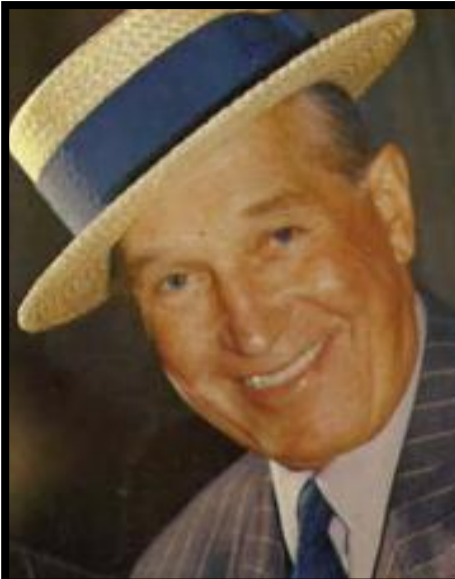
Maurice Chevalier 1888-1972