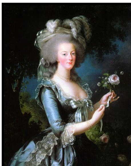
Marie-Antoinette d'Autriche 1755 - 1793

TOUTES LES INFORMATIONS APPARAISSANT SUR CES CARTES PROVIENNENT D'INTERNET (GOOGLE IMAGES, WIKIPEDIA ET AUTRES)