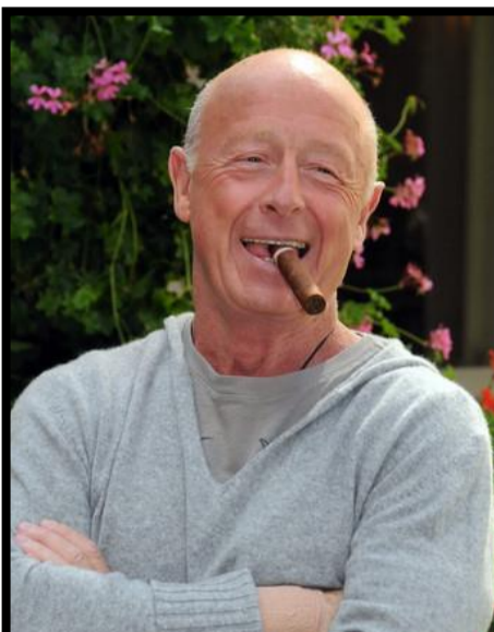
Tony Scott 1944 - 2012