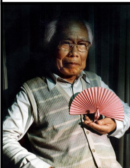
Akira Yoshizawa 1911 - 2005