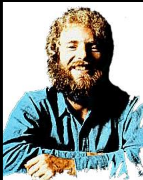
Tom Fogerty 1941 - 1990