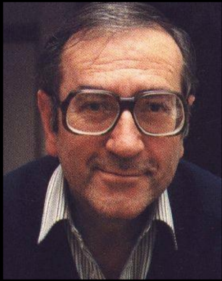
Gaston Miron 1928 - 1996

C'est la date anniversaire de la signature de la Convention internationale des droits de l'enfant le 20 novembre 1989 par 191 pays. En 1954, l'Assemblée générale des Nations unies recommande que tous les pays instituent une Journée mondiale de l'enfance, sans pour autant en fixer le jour. Le choix du 20 novembre viendra plus tard.