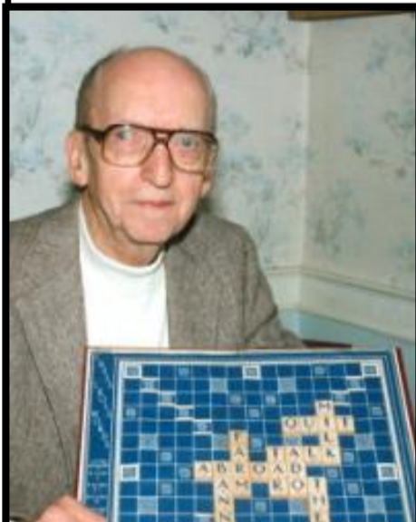
Alfred Mosher Butts 1899 - 1993

Il meurt d'une succession d'embolies pulmonaires.