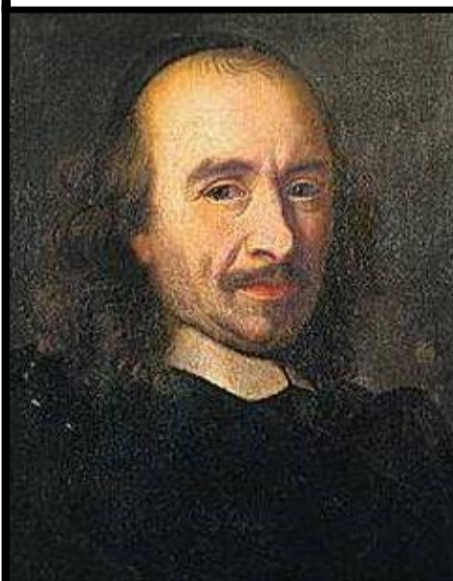
Pierre Corneille 1606 - 1684