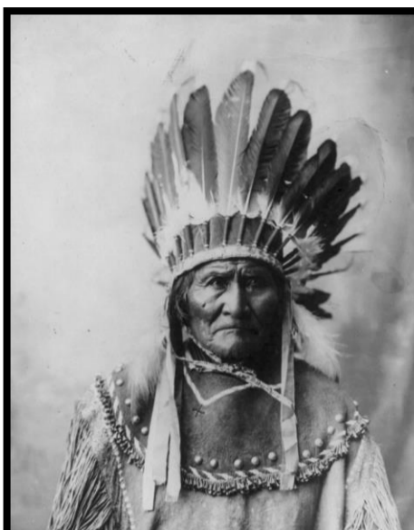
Geronimo 1829 - 1909