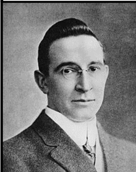
Bertie Charles Forbes 1880 - 1954