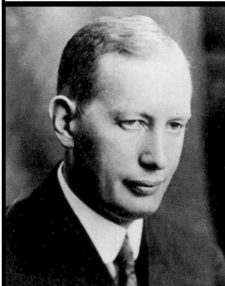
Ruben Rausing 1895 -1983