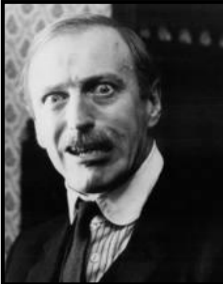
Graham Chapman 1941 - 1989