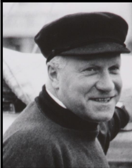
Marcel Bich 1914 - 1994