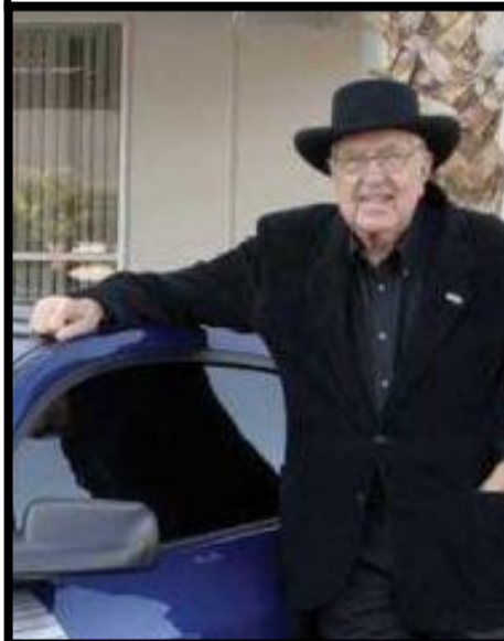
Carroll Shelby 1923 - 2012