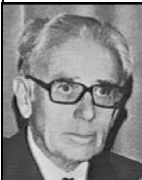
Hermann Brandt 1897 – 1972