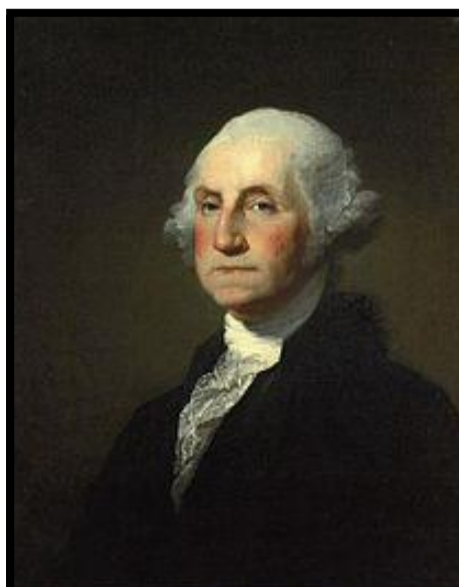
George Washington 1732 - 1799

TOUTES LES INFORMATIONS APPARAISSANT SUR CES CARTES PROVIENNENT D'INTERNET (GOOGLE IMAGES, WIKIPEDIA ET AUTRES)