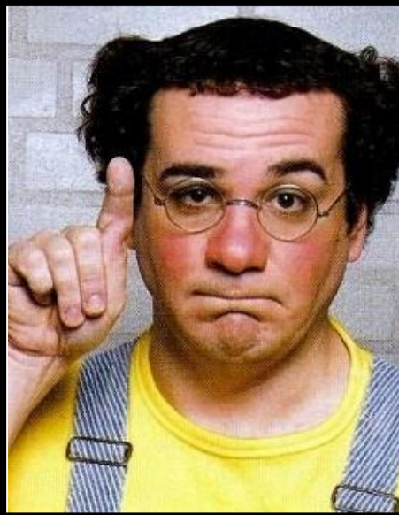
Coluche 1944 - 1986