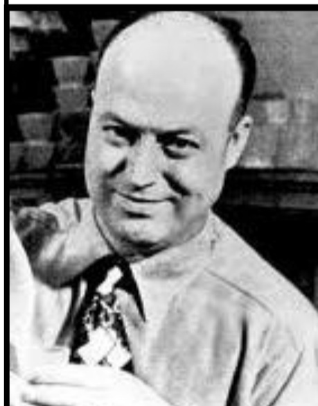
Earl Tupper 1907 - 1983