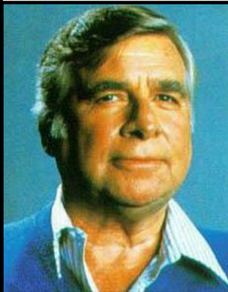
Gene Roddenberry 1921 - 1991