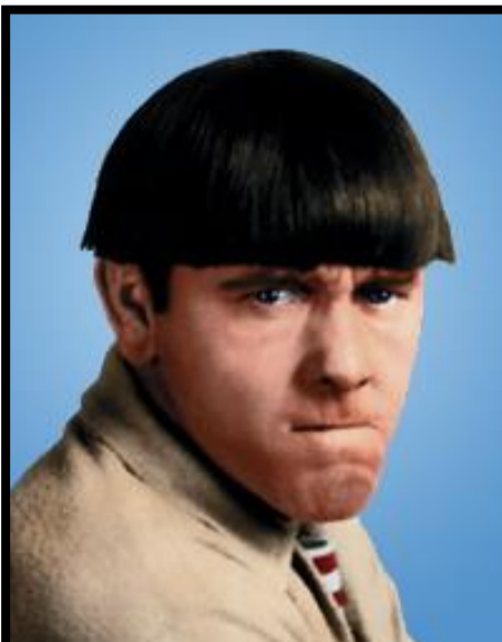
Moe Howard 1897 - 1975