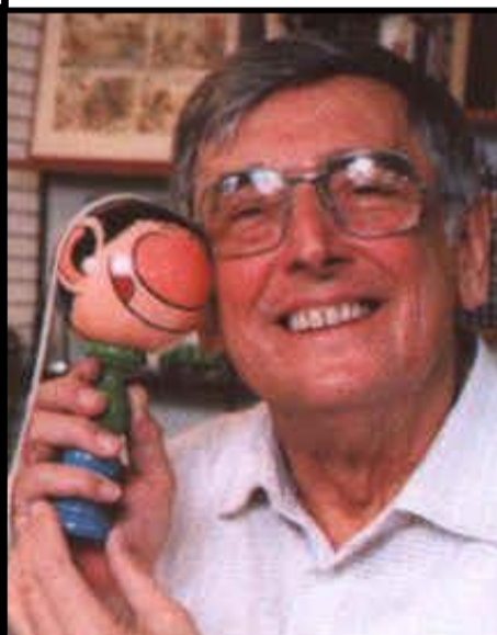
André Franquin 1924 - 1997