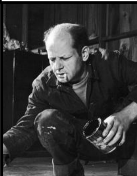
Jackson Pollock 1912 - 1956