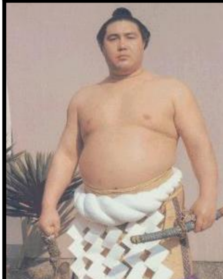
Taiho Koki 1940 - 2013