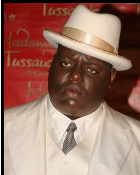
The Notorious B.I.G 1972 - 1997