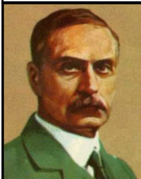
Karl Landsteiner 1868 - 1943