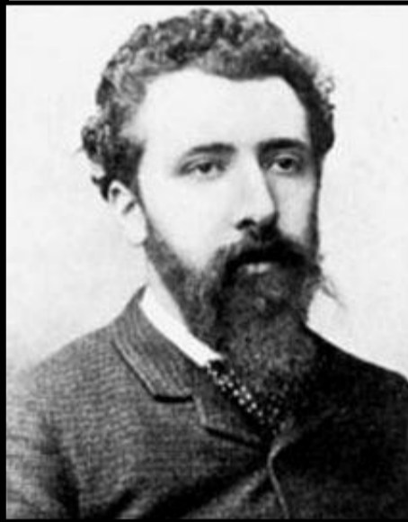
Georges Seurat 1859 -1891