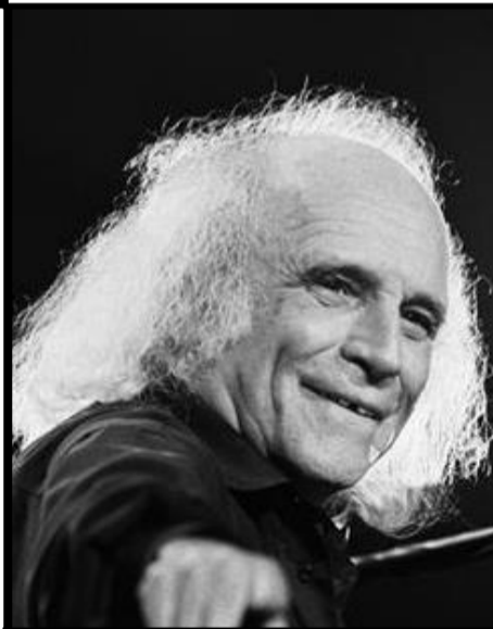
Léo Ferré 1916 - 1993