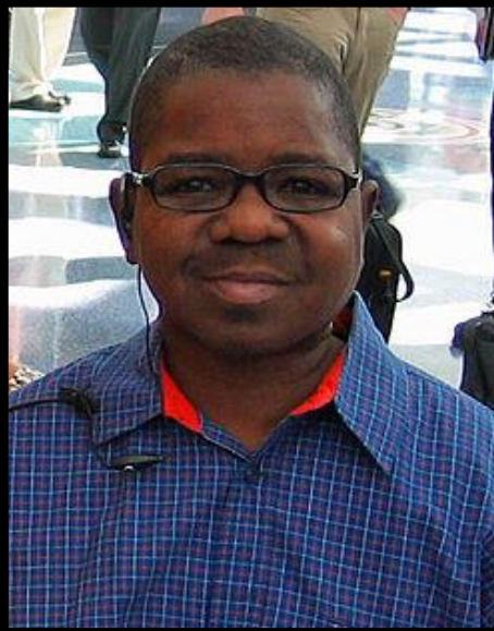
Gary Coleman 1968 - 2010