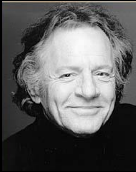
Claude Léveillée 1932 - 2011

C'est une course à vélo qui se tient actuellement sur plus de 3 000 kilomètres et qui est organisée par ASO (Groupe Amaury). « Le Tour » ou encore « la Grande Boucle », tel qu'on le nomme aussi en France, est considéré comme la plus prestigieuse épreuve cycliste du monde mais est depuis quelques années minée par des cas de dopages...