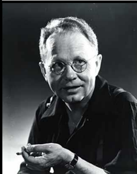
Grant Wood 1891 - 1942