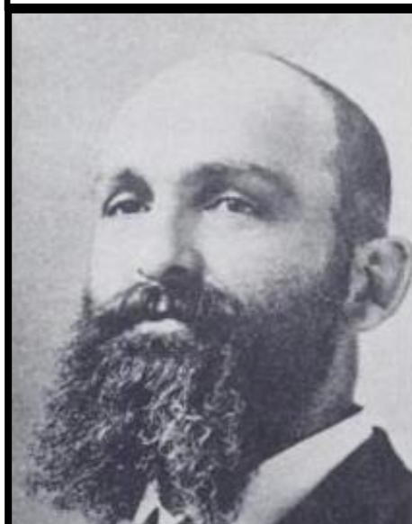
Whitcomb Judson 1836 - 1909