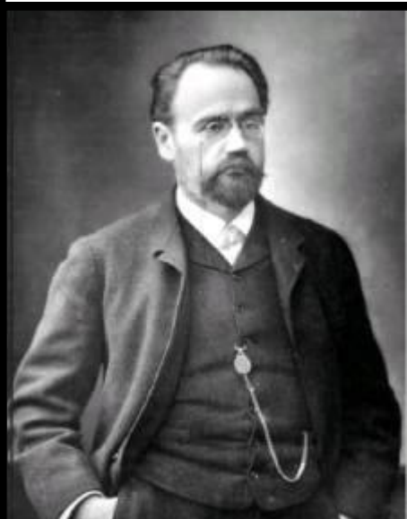
Émile Zola 1840 - 1902