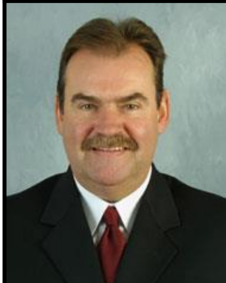
Pat Burns 1952 – 2010