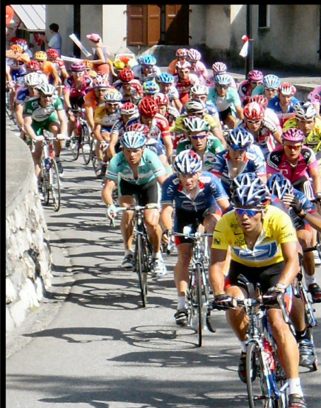
LE TOUR DE FRANCE MOIS DE JUILLET