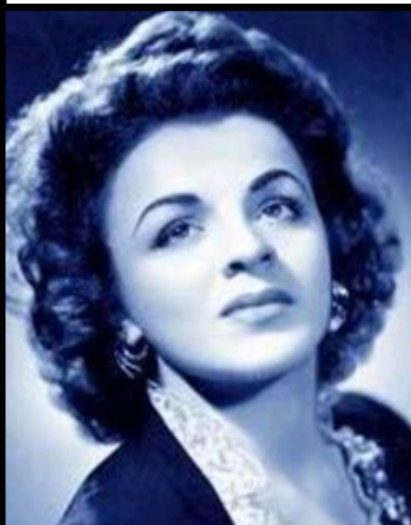
Alys Robi 1923 - 2011