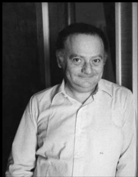
René Goscinny 1926 – 1977

Une surdose de médicaments provoque sa mort.