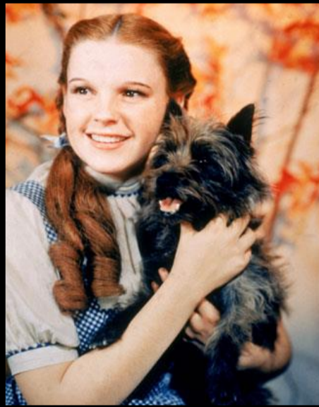
Judy Garland 1922 - 1969