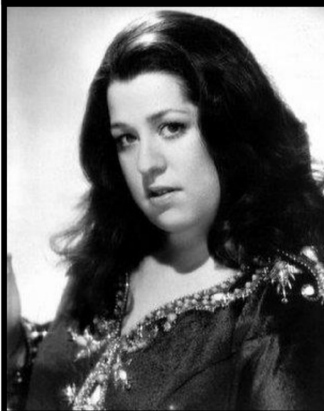
Cass Elliot 1941 - 1974