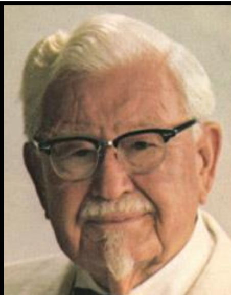
Le Colonel Sanders 1890 - 1980