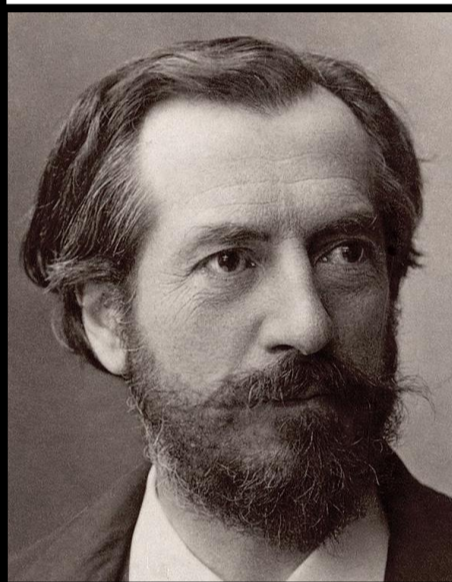
Frédéric Auguste Bartholdi 1834 – 1904

Il meurt de la leucémie après s'être battu pendant 7 longs mois contre la maladie.