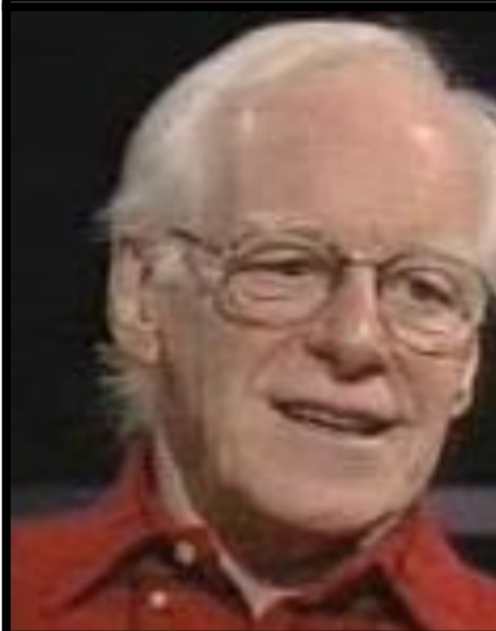
Pierre Bourgault 1934 - 2003

Organisé pour la première fois en 2005 par l'éditeur du livre, elle se renouvelle chaque année à date fixe dans l'ensemble du monde.