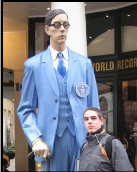
JOURNÉE DES RECORDS GUINNESS MOIS DE NOVEMBRE