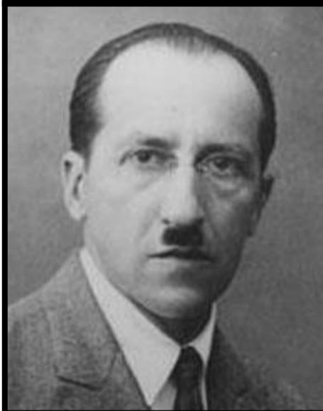
Piet Mondrian 1872 – 1944

Il meurt d'une hémorragie interne hépatique.