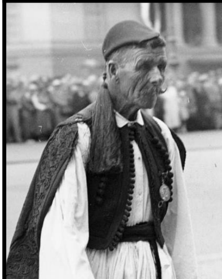
Spyridon Louis 1873 – 1940