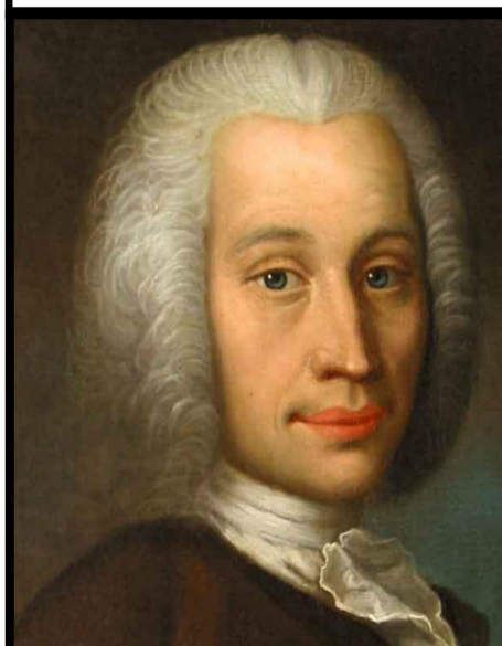
Anders Celsius 1701 - 1744