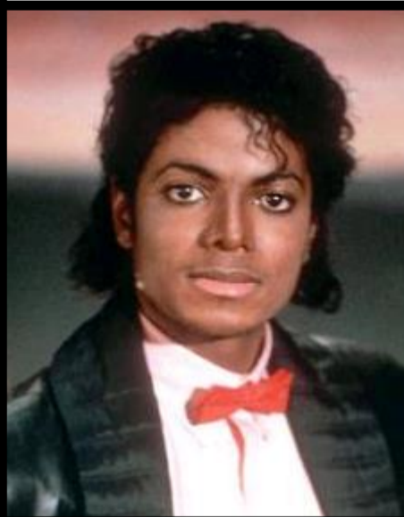
Michael Jackson 1958 - 2009