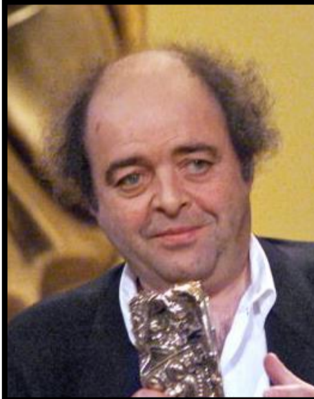
Jacques Villeret 1951 - 2005