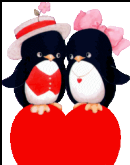
LA ST-VALENTIN 14 FÉVRIER