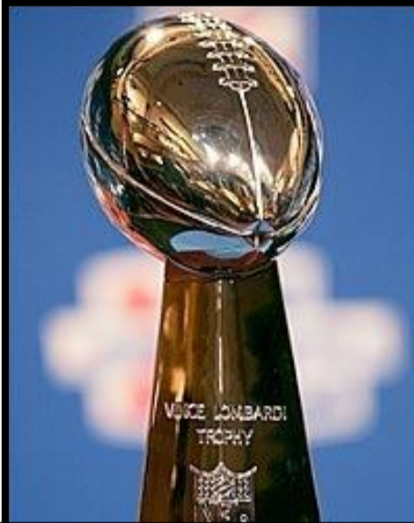
SUPER BOWL MOIS DE FÉVRIER