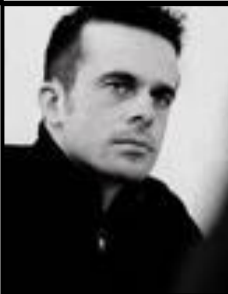
Iain MacMillan 1938 – 2006

Peu de détails au sujet de sa mort sont disponibles.