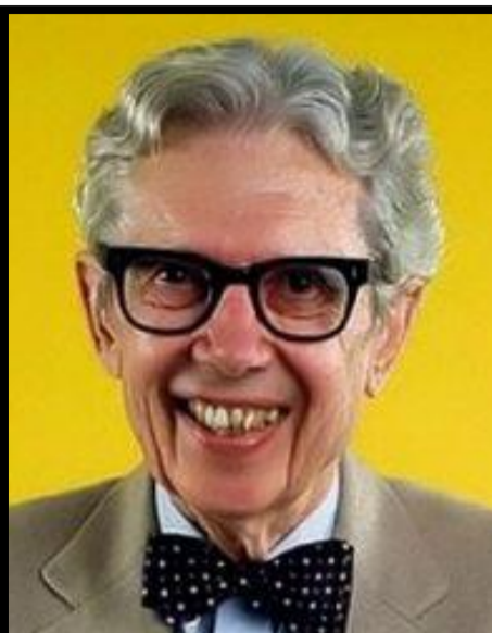
Orville Redenbacher 1907 - 1995