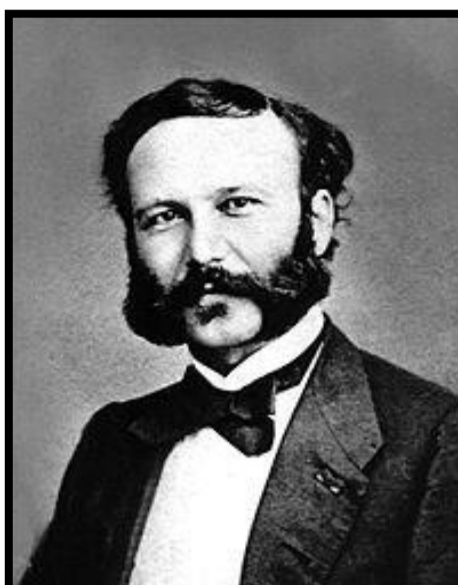
Henri Dunant 1828 - 1910

TOUTES LES INFORMATIONS APPARAISSANT SUR CES CARTES PROVIENNENT D'INTERNET (GOOGLE IMAGES, WIKIPEDIA ET AUTRES)