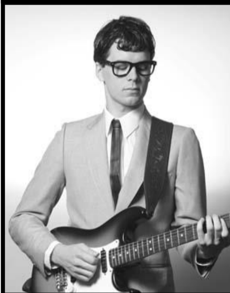
Buddy Holly 1936 - 1959