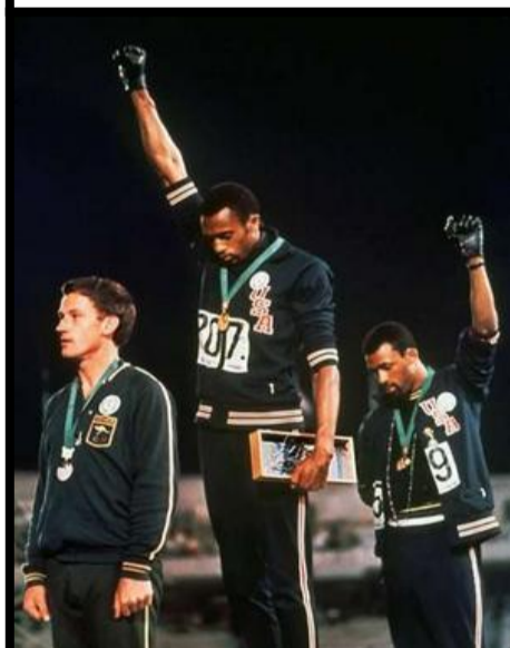
Peter Norman 1942 – 2006