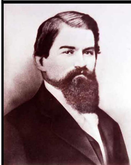
John Pemberton 1831 - 1888