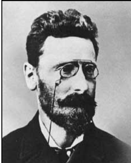
Joseph Pulitzer 1847 - 1911