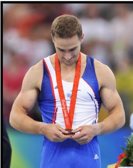
JEUX OLYMPIQUES TOUS LES 4 ANS