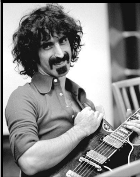
Frank Zappa 1940 - 1993