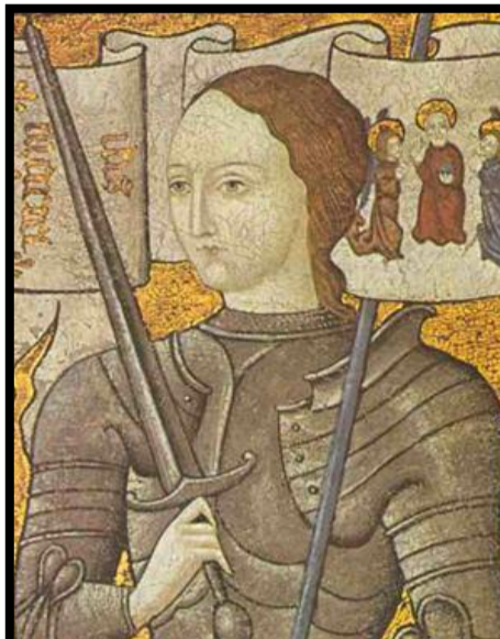
Jeanne D'Arc 1412 - 1431

TOUTES LES INFORMATIONS APPARAISSANT SUR CES CARTES PROVIENNENT D'INTERNET (GOOGLE IMAGES, WIKIPEDIA ET AUTRES)