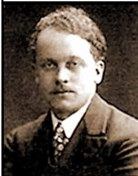
Raoul Dufy 1877 – 1953