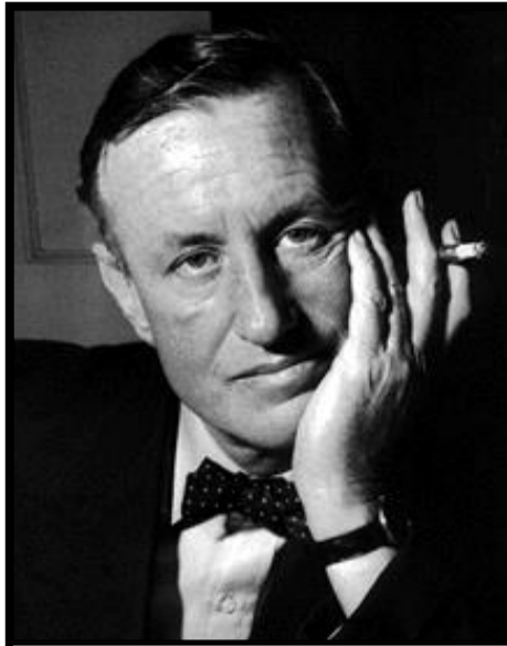
Ian Fleming 1908 - 1964