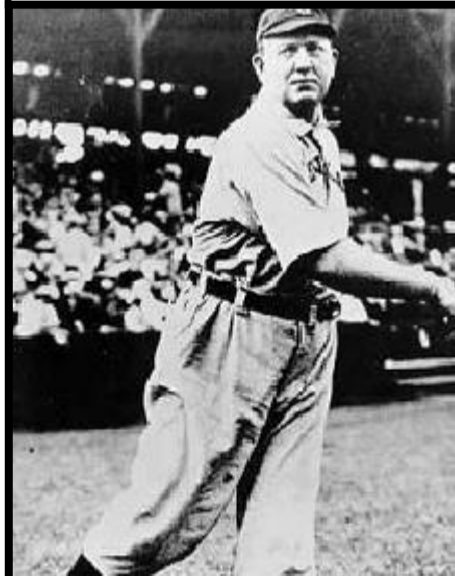
Cy Young 1867 – 1955