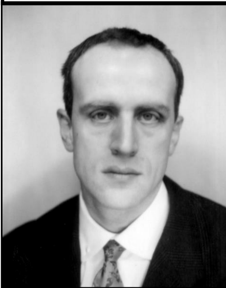
Boris Vian 1920 - 1959