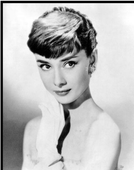
Audrey Hepburn 1929 - 1993