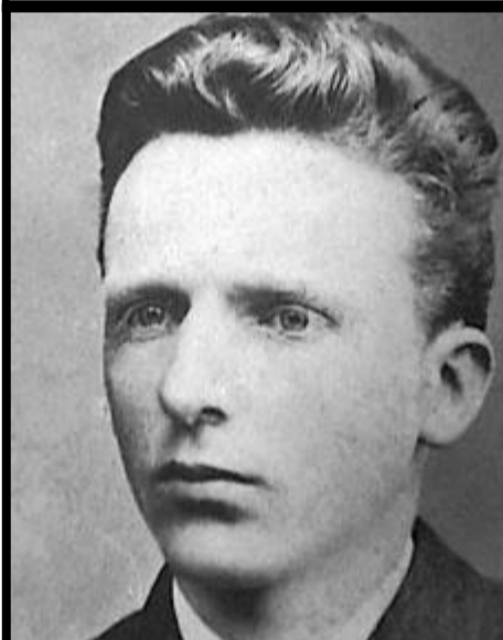
Vincent Van Gogh 1853 – 1890