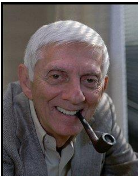
Aaron Spelling 1923 - 2006