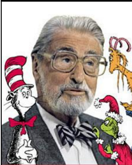
Theodor Seuss Geisel 1904 - 1991