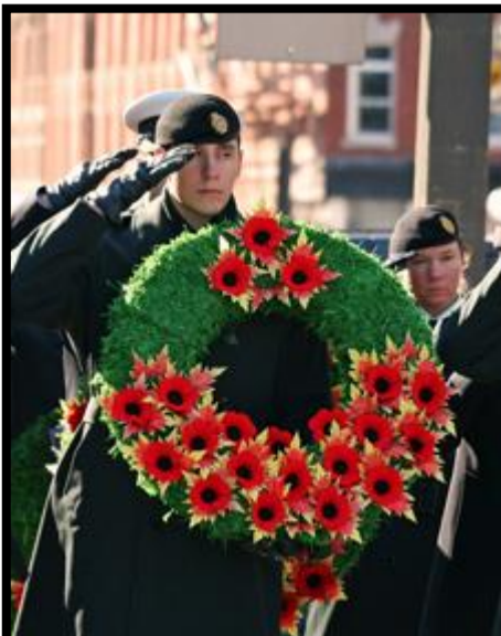
JOUR DU SOUVENIR 11 NOVEMBRE