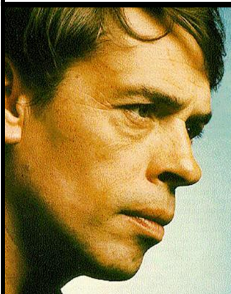
Jacques Brel 1929 - 1978