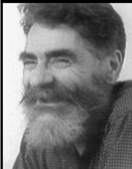
Alfred Desrochers 1901 - 1978

C'est une journée de commémoration annuelle observée en Europe et dans les pays du Commonwealth pour commémorer les sacrifices de la Première Guerre mondiale ainsi que d'autres guerres. Cette journée a lieu le 11 novembre pour rappeler la signature de l'Armistice mettant fin à la Première Guerre mondiale, en 1918.