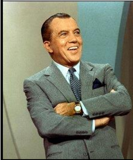
Ed Sullivan 1901 - 1974