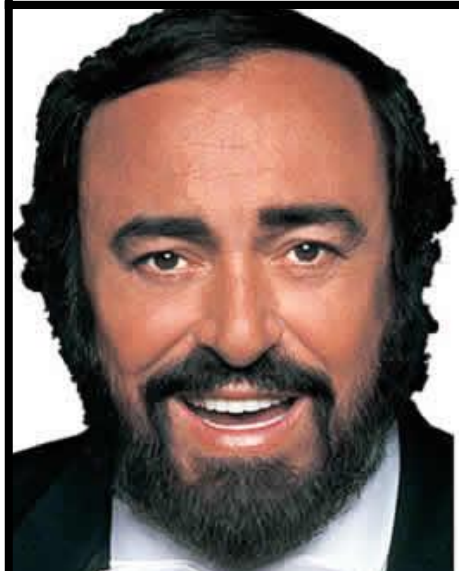
Luciano Pavarotti 1935 – 2007

Il est mort en grande partie méconnu et oublié des siens