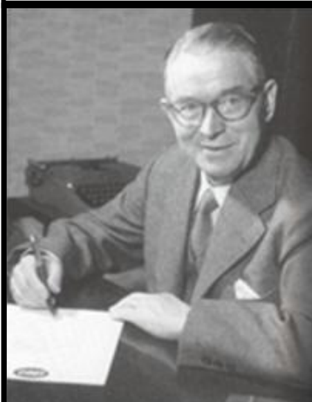
Ole Kirk Christiansen 1891 – 1958