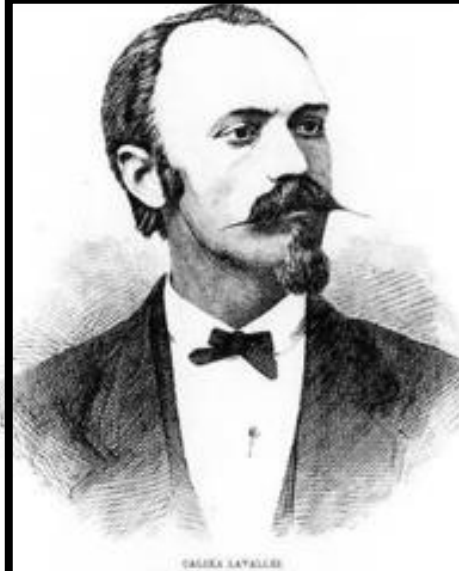
Calixa Lavallée 1842 - 1891

Il est célébré en février aux États-Unis et au Canada et en octobre au Royaume-Uni. Au Canada, ce mois est célébré depuis décembre 1995