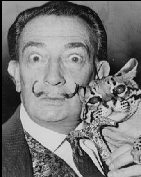
Salvador Dali 1904 – 1989

Il est mort des suites d'une intoxication aiguë due aux effets combinés de six médicaments.