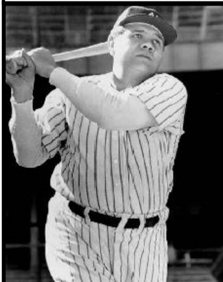
Babe Ruth 1895 – 1948

Sa mort est tout bonnement attribuable à la vieillesse.