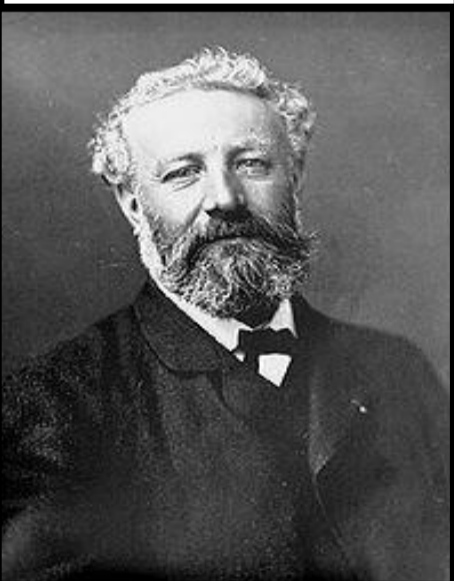
Jules Verne 1828 – 1905

Il est mort d'une défaillance cardiaque.