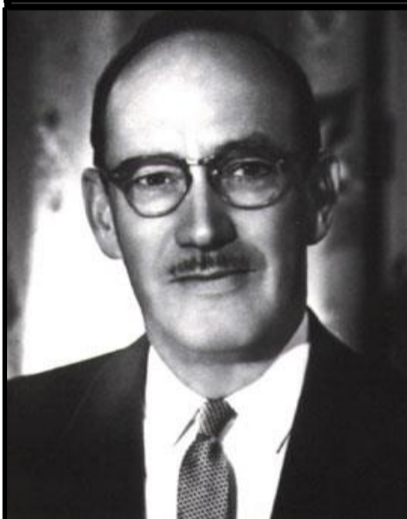
J.-Armand Bombardier 1907 – 1964

La date du Nouvel An chinois dans le calendrier grégorien varie d'une année sur l'autre, mais tombe toujours entre le 21 janvier et le 20 février.