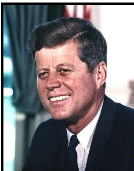
John F. Kennedy 1917 – 1963