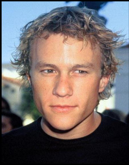
Heath Ledger 1979 – 2008