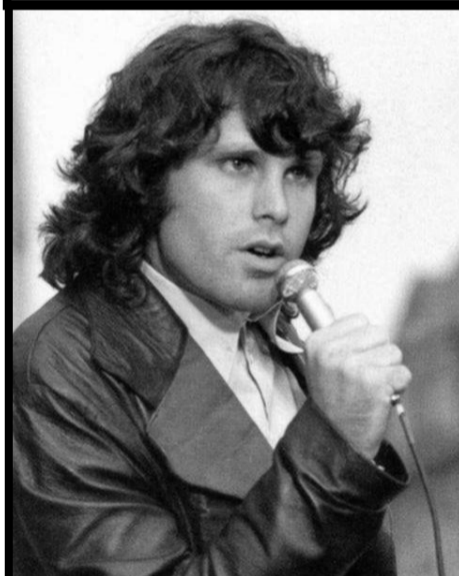
Jim Morrison 1943 – 1971

Il est mort des suites d'un cancer de l'estomac