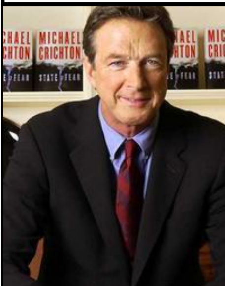
Michael Crichton 1942 - 2008