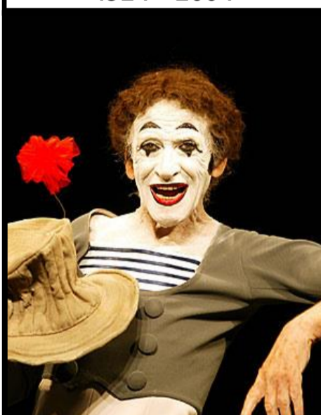
Marcel Marceau 1923 – 2007

Il est mort d'une insuffisance respiratoire.