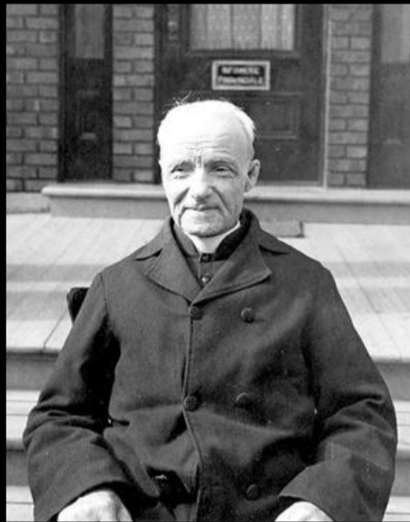
Le frère André 1845 - 1937

C'est un jour férié et chômé au Québec le lundi qui précède le 25 mai de chaque année. Depuis 2003, les Québécois et les Québécoises profitent de cette journée pour « souligner l'importance de la lutte des patriotes de 1837-1838 pour la reconnaissance de notre nation, pour sa liberté politique et pour l'établissement d'un gouvernement démocratique »