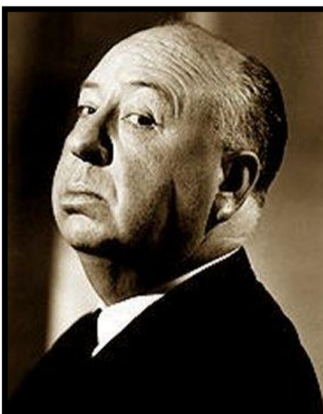
Alfred Hitchcock 1899 - 1980