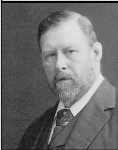
Bram Stoker 1847 - 1912

Officiellement mort de la leucémie. Peut-être du Sida.