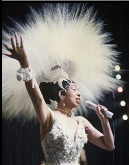
Joséphine Baker 1906 – 1975